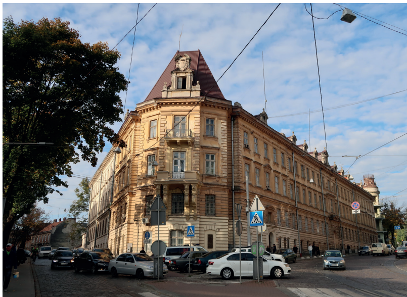
Jedním z míst, kde NKVD vyšetřovala osoby odvěčené z ČSR, byla vazební věznice č. 1 v ukrajinském Lvově. Dnes je v budově památník a muzeum „Věznice na Lonckého“ („Tjurma na Lonckogo“).