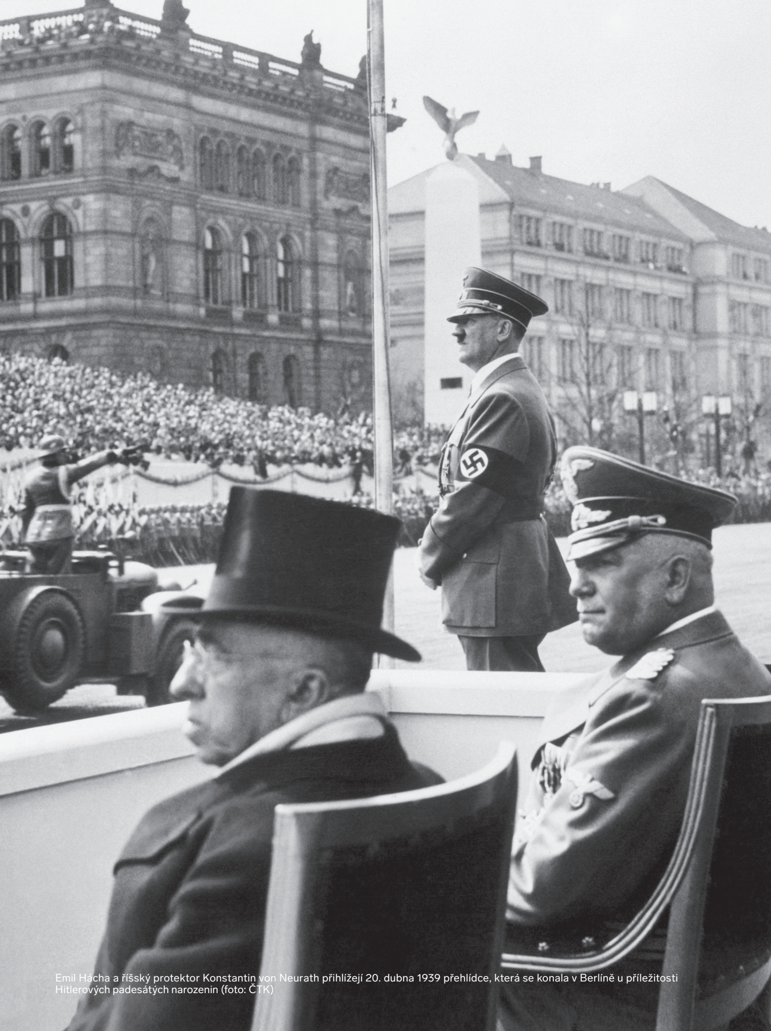
Emil Hácha a říšský protektor Konstantin von Neurath přihlížejí 20. dubna 1939 přehlídce, která se konala v Berlíně u příležitosti Hitlerových padesátých narozenin