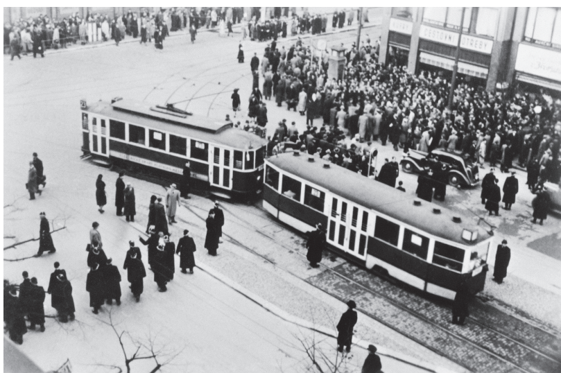
Centrum Prahy 28. října 1939 odpoledne. Podle letáků „Československého odboje“ měly v šest hodin večer proběhnout v horní části Václavského náměstí dvě minuty ticha. „Revoluční výbor“ k tomu ve své tiskovině dodával, že shromáždění se pak přesune k Wilsonovu pomníku u hlavního nádraží. (foto: ČTK)

chybě při vyřizování staré agendy: s vykonáním slibu se počítalo již v květnu 1939 a věc se znovu otevřela v souvislosti se skládáním přísahy vládního vojska. 41 Neurathův kabinet proto začal podnikat všechny potřebné kroky a jenom to Háchově kanceláři zapomněl oznámit. Jak ale Völckers sám uvedl, naposledy byla tato záležitost „připomenuta přípisem říšského protektora na říšského kancléře, ve kterém říšský protektor podával zprávu i o dopisu pana státního prezidenta na říšského kancléře z 11. října“ o porušování protektorátní autonomie. 42