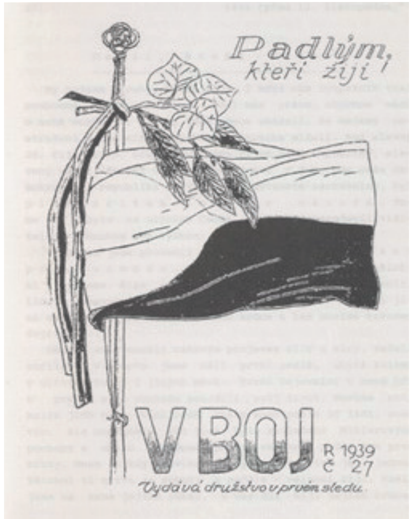
Obálka 27. čísla ilegálního časopisu V boj , jehož obsah byl věnován významu demonstrací z 28. října 1939

Zpevněný postoj protektorátní vlády se bezprostředně odrážel v tom, jak důsledně trvala na své interpretaci pražských říjnových manifestací. Například už osmistránková zpráva policejního ředitelství v Praze z 28. října 1939 podrobně dokladovala různé německé provokace, které pak přispěly k radikalizaci. 58 Stahlecker naopak tvrdil, že tyto jednotlivé případy jsou neuvěřitelně zveličeny, aby tak zakryly možná i záměrné nezvládnutí situace. 59 Hácha pak 7. listopadu 1939 Neurathovi písemně odpověděl na jeho dřívější přípis, který obdržel v souvislosti s požadavkem na složení slibu věrnosti Hitlerovi. V principu jeho text neodmítal, pokud v něm bude současně vyjádřena jeho vazba