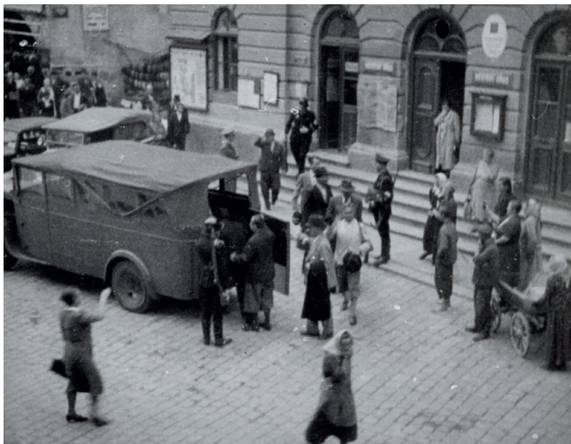
Třeboň 1. září 1939. Gestapo zatýká lidi, které evidovalo v kartotéce A jako nepřátele režimu. Za jejich propuštění měl Chvalkovský intervenovat během schůzky s Hitlerem.

Podle pokynů Háchovy kanceláře měl Chvalkovský v Berlíně skutečně intervenovat za propuštění osob, kte- ré byly při vypuknutí války tzv. pre- ventivně pozatýkány. Tato akce Gesta- pa, provedená podle kartotéky A