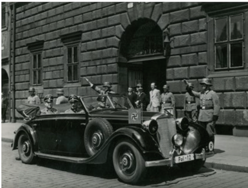
Státní tajemník K. H. Frank (vedle řidiče) současně zastával funkci vyššího velitele SS a policie v protektorátu. Ve svých zprávách pro Berlín situaci záměrně dramatoval, aby tak získal souhlas k zastrašujícím zásahům proti českému obyvatelstvu.

rozdílného zacházení s protektorátními příslušníky českého a německého původu. 60