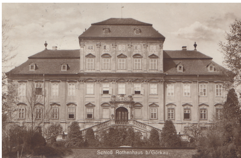
Zámek Červený hrádek

Není jasné, z jakých důvodů byla konfiskace majetku u takto exponovaného aktéra z předmnichovské i pomnichovské éry pozdržena. Skutečnost, že se věc táhla do roku 1948, mohla být způsobena např. odvoláním proti konfiskační vyhlášce u Nejvyššího správního soudu a zdlouhavým odvolacím řízením. Ve fondu Nejvyššího správního soudu se ovšem stížnost Maxe