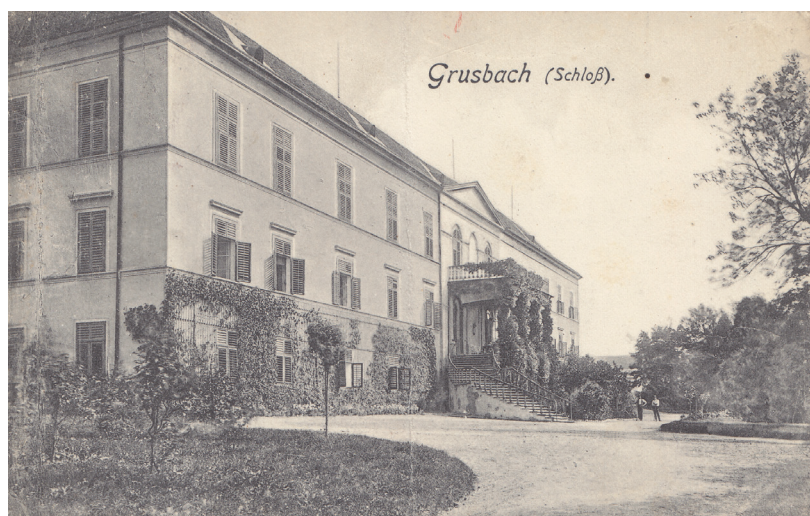
Zámek Hrušovany, kde od poloviny dvacátých let vyvíjelo svou činnost společenství tzv. hrušovanských pánů

„oddaných“ šlechticů, mezi nimi přední místo zaujímal Maxmilián (Max) Lobkowicz z roudnické primogenitury, který byl v letech 1920 až 1926 členem československé diplomatické mise v Londýně. 17 Na československé ambasádě v Římě působil Gustav Villani de Castelo Pillonico pocházející z původně italské šlechtické rodiny, která se v 17. století usadila v Čechách. V roce 1919 přijal na návrh členů Národního výboru Zdenko Radslav Kinský, příslušník staré české šlechtické rodiny, pozici ataše ve společenském oddělení zahraničního úřadu, který byl podřízen přímo ministerskému