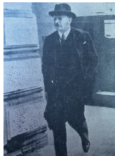
Frank Arthur Ashton-Gwatkin

Československo po skončení války jevílo zájem o objasnění Hohenloheho činnosti během Runcimanovy mise. Patnáct fasciklů jeho korespondence pocházejících z Červeného hrádku se nejprve ocitlo ve Studijním ústavu MV, odtud se dostaly na ministerstvo sociální péče, v jehož čele stál komunist Zdeněk Nejedlý. 42 Dne