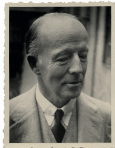
Lord Runciman

Bezprostřední reakce Hohenloheho na nacionálněsocialistické převzetí moci a připojení Rakouska k třetí říši se nám nedochovaly. Lze však předpokládat, že obě události tajně vítal, aniž se stal Hitlerovým