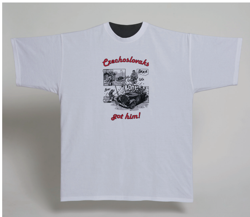
„Čechoslováci ho dostali!“ Popkulturní ozvěna atentátu na Reinharda Heydricha jím svým vlastním životem paralelně s oficiální vzpomínkovou kulturou.

Pro mě je nejzajímavější Heydrichův „druhý život“. To je velmi napínavé téma, které se v literatuře moc neobjevuje. Většina jeho biografí končí jeho smrtí nebo pohřbem. Ale je tady