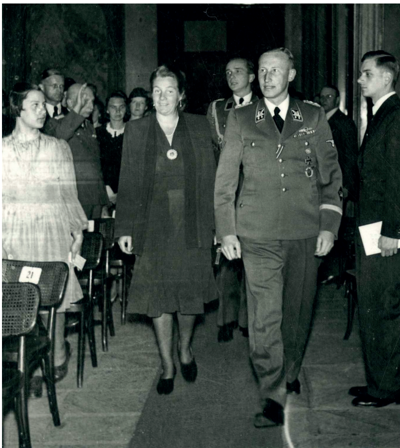
Reinhard Heydrich s manželkou Linou ve Valdštejnském paláci v Praze 26. května 1942. Následujícího dne byl na něj proveden atentát.