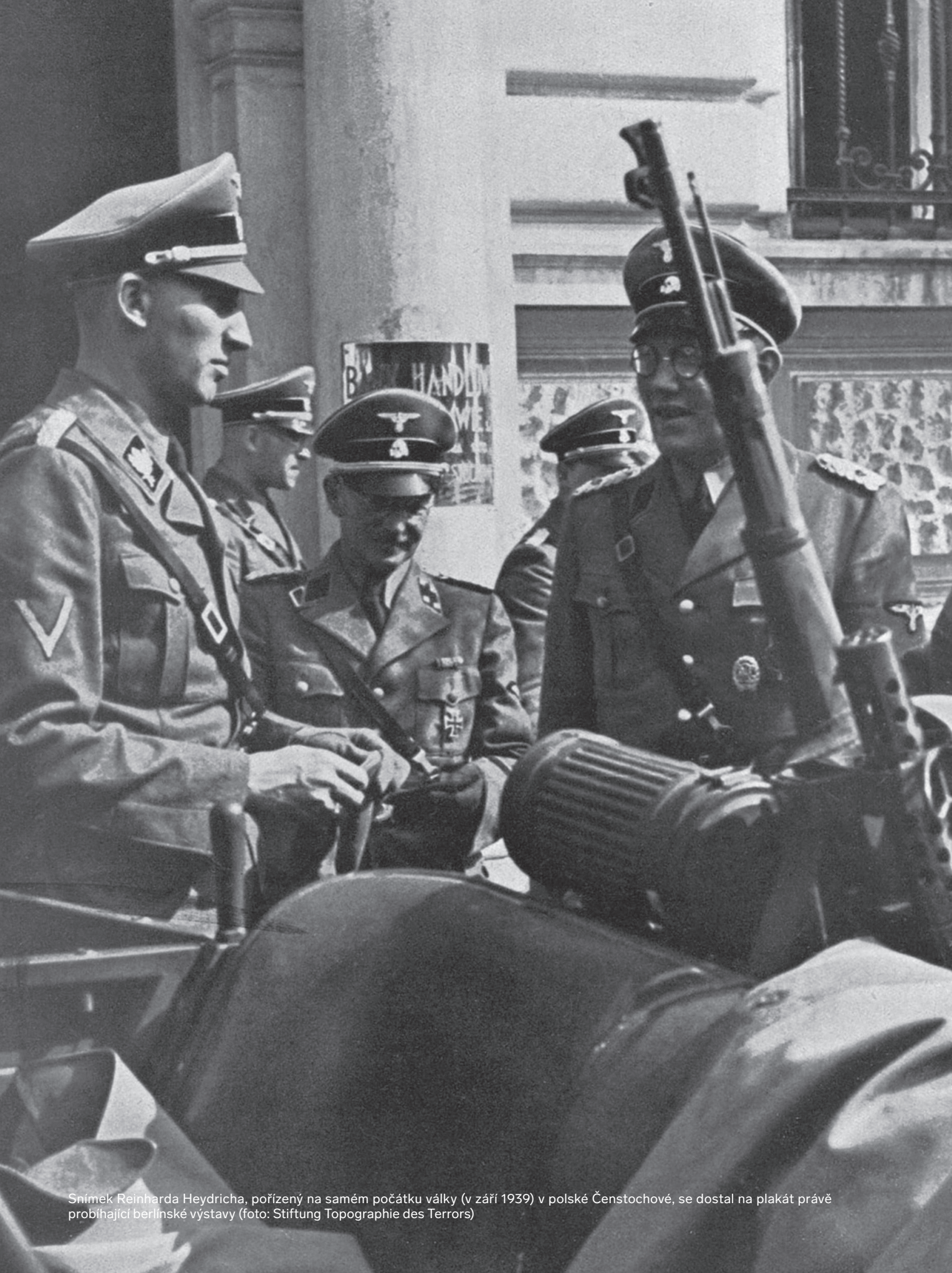
Snímek Reinharda Heydricha, pořízený na samém počátku války (v září 1939) v polské Čenstochové, se dostal na plakát právě probíhající berlínské výstavy