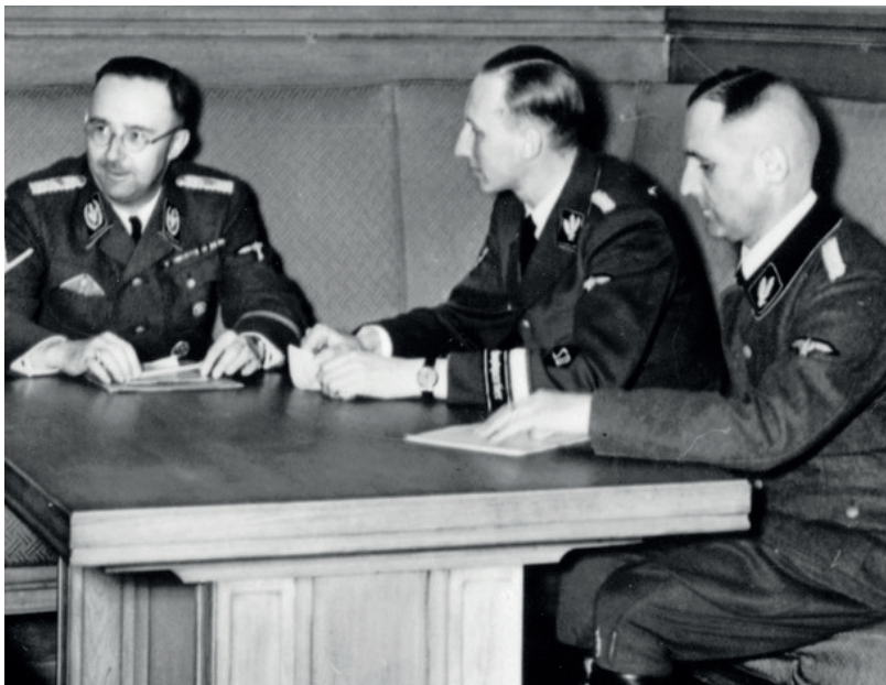
Zleva Heinrich Himmler, Reinhard Heydrich a šéf Gestapa (1939–1945) Heinrich Müller v Mnichově v září 1939

policie, tedy civilní i neuniformované policie – Gestapa a kriminální policie.