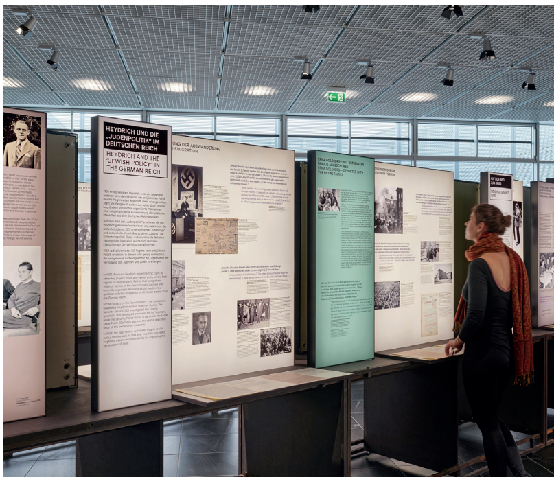
Výstava Reinhard Heydrich. Kariéra a násilí, kterou doplňuje doprovodný program v podobě přednášek, diskuzí a filmových projekcí, bude v berlínské Topografii teroru k vidění až do 10. června 2025