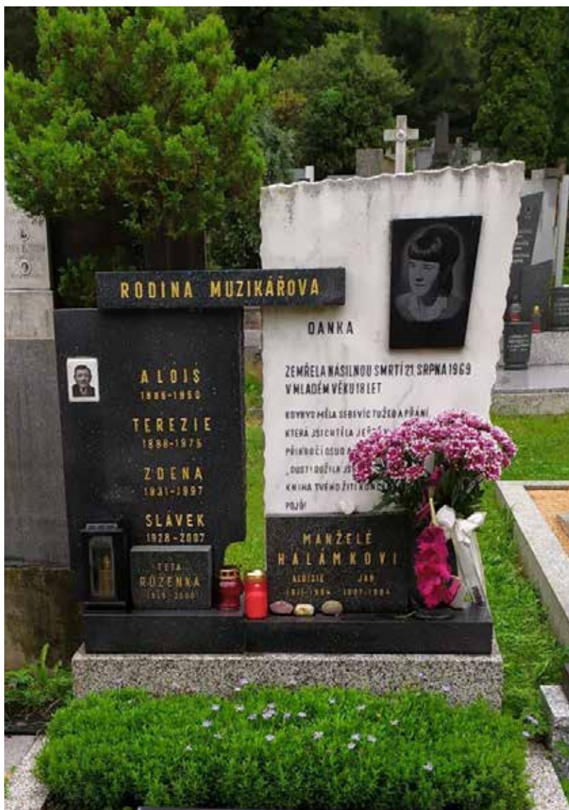
Náhrobek Danuše Muzikářové pořízený za příspěvek ministerstva vnitra

Zákon č. 482/2020 Sb. nabyl účinnosti 1. ledna 2021 a do 31. května 2024 bylo na odbor právní MV ČR podáno jen dvanáct (!) žádostí o odškodnění. V roce 2021 jich bylo podáno a vyřízeno jedenáct, z toho osm kladně. Ve dvou případech šlo o zranění s trvalými následky, v pěti o zranění a v jednom o usmrcení. Zbývající tři žádosti – dvě zranění a jedno usmrcení – byly zamítnuty. V následujícím roce 2022 nebyla podána žádná žádost o odškodnění. V roce 2023 přišla pouze jedna žádost – týkala se zranění a byla vyřízena kladně. Do jara 2024 zatím nebyla přijata žádná další. Celková dosud vyplacená částka činí 620 000 Kč