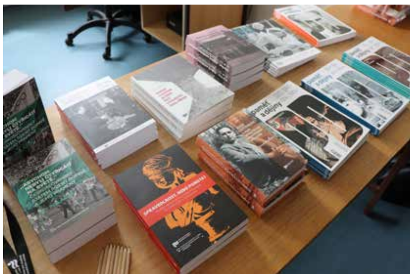
Publikační činnost ÚSTR se mimo jiných témat intenzivně věnuje také vyrovnání se s trestněprávním dědictvím předlistopadové doby

a naopak o dorovnávání důchodů disidentů. Na druhou stranu, bez podkladů ÚSTR a jím shromážděných a vyhodnocených materiálů z ABS není možno o takových a dalších věcech rozhodovat. Zde je jedna z mnoha rolí Ústavu, tedy být odborným zpracovatelem a garantem materiálů souvisejících s historickou pamětí a nápravou křivd totalitního režimu, popsáním systému jeho fungování, pachatelů i obětí. To vše při respektování zásad vědeckého výzkumu a platného právního řádu ČR.