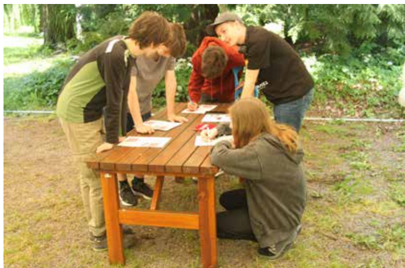
Studenti během projektové hodiny v rámci Letní školy pro studenty středních škol, která se konala v červnu 2024 ve Svatém Janu pod Skalou na Berounsku. Akci uspořádal ÚSTR společně s Muzeem paměti XX. století.

(Ne)vyrovnání s komunistickou minulostí v evropském kontextu, která se bude konat v listopadu 2024 a přinese neopomenutelnou komparaci států bývalého sovětského bloku a jejich stavu vyrovnání se s trestněprávním dědictvím z doby komunistického režimu. Na řadu otázek v tomto směru by měla upozornit také odborná konference v říjnu 2024 na téma Československá justice 1948–1989 jako pilíř režimu , na níž zazní příspěvky popisující celé období let 1948–1989, kdy nejenom v trestním právu platil úkol práva „chránit společenské a státní zřízení Československé socialistické republiky, socialistické vlastnictví, práva a oprávněné zájmy občanů a vychovávat k řádnému plnění občanských povinností a k zachovávaní pravidel socialistického soužití“ (§ 1 v době před rokem 1989 platného a účinného trestního zákona č. 140/1961 Sb.). Kromě výše uvedených příkladů plnění zákonného poslání ÚSTR