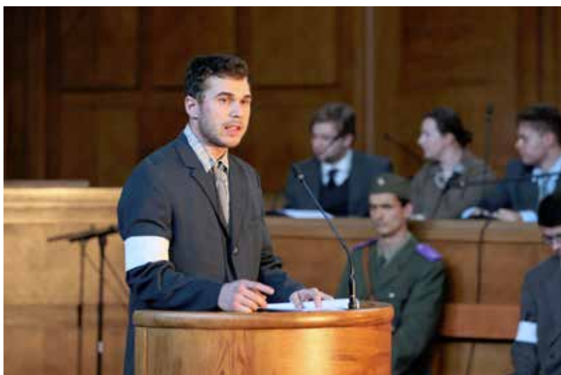
Studenti Právnické fakulty Univerzity Karlovy letos svým představením připomněli politický proces s neratovickými uční z roku 1949

Další z rolí ÚSTR a Archivu bezpečnostních složek (ABS) je digitalizace archivních dokumentů, vytváření prezentací a zajištění přístupu badatelů a veřejnosti k materiálům zachycujícím fungování represivního aparátu komunistického režimu. Z nejnovějších aktivit v tomto směru je možno zmínit webovou prezentaci k 55. výročí srpnové okupace Československa vojsky zemí Varšavské smlouvy. 19 Na jednom místě lze jednoduše dohledat vybrané dokumenty k bezpečnostnímu aparátu z proveniencí ministra vnitra (více než 600 dokumentů), spolupráci s KGB (cca 300 dokumentů), dobovému domácímu a zahraničnímu tisku (české vysílání Rádía Vatikán a monitoring československého tisku, rozhlasu a televize pořízený