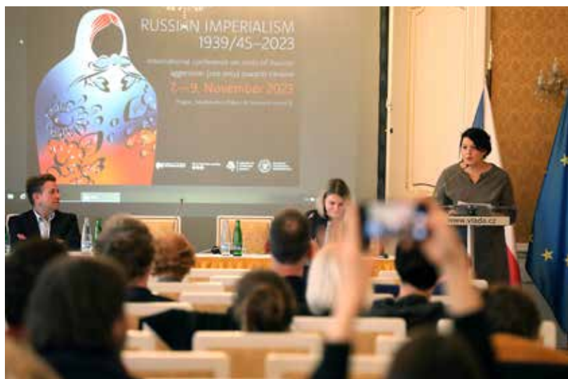
Na třídní konferenci o ruském imperialismu vystoupili řečníci z více než desítky zemí

pozadí nedostatečného vyrovnání se s křivdami komunistické doby i epochy jí předcházející. 13