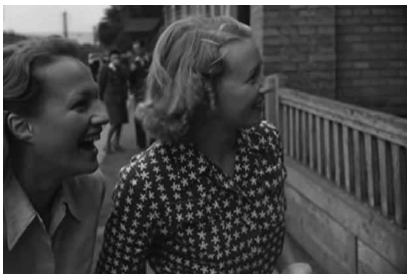
Adina Mandlová a Nataša Gollová na záběru z reportážního snímku Filmernte II. Filmové žně Zlín 1941

Jinou, ve své době ne příliš veřejně prezentovanou stránkou Filmových žní byly různé aférky, večírky a jiné noční aktivity předních festivalových