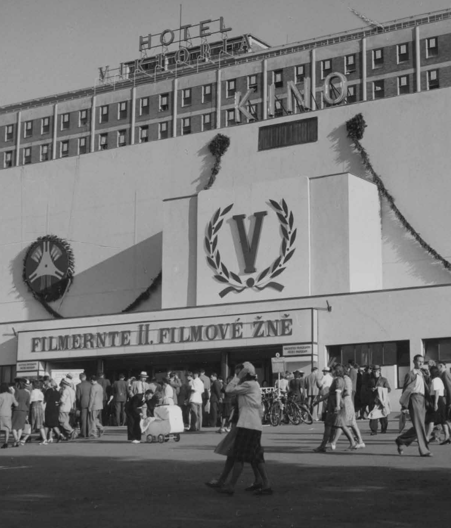
Slavnostně vyzdobené velké kino ve Zlíně vítá návštěvníky 2. ročníku Filmových žní