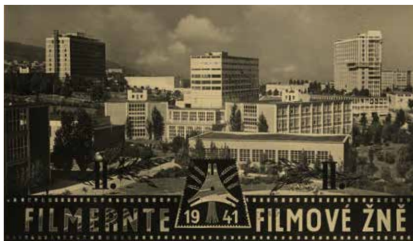
Pohlednice z Filmových žní 1941