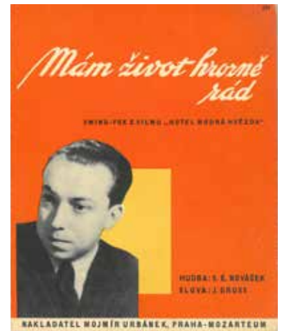
Písničky z filmů uváděných na Filmových žních

z nich se spolu s ostatními pozvanými hosty do Zlína dostala z Prahy speciálně vypraveným vlakem. 41 Byli ale i tací, kteří přijeli na kolech, jako