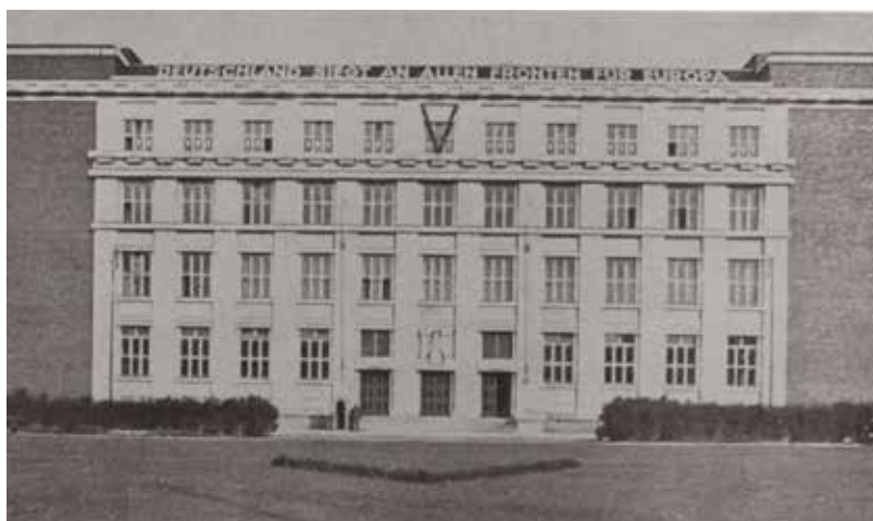
Budova Právnické fakulty Masarykovy univerzity, v letech 1940–1945 sídlo brněnského Gestapa, vyzdobená v rámci propagandistické akce „Viktoria“

Vzhledem k relativně marginálnímu významu referátu II P bylo v polovině války rozhodnuto o jeho začlenění do referátu II BM 40 a jeho „degradaci“ na obor (Sachgebiet) II BM/P, k čemuž došlo nejpozději v květnu 1943. Pagnacco i nadále zůstal jeho vedoucím. Kromě něj působila v oboru už jen jedna sekretářka. 41 V březnu 1944 proběhla na brněnské řídicí úřadovně velká reorganizace, během níž se přistoupilo k rozpuštění a přečíslování referátů. Referát II BM získal nové označení IV 1 b a byly mu podřízeny čtyři obory. Stávající obory II BM 1 a II P byly sloučeny do oboru IV 1 b 2 c (tisk a kulturní záležitosti, politické i nepolitické spolky a svazy), který vedl kriminální tajemník Friedrich Lacina 42 . I v jeho případě se jednalo o bývalého rakouského kariéerního policistu, což ostatně platilo i pro tři zbývající vedoucí oborů. Pagnacco pracoval v Lacinově oboru až do konce války a i nadále měl na starost kulturně-tiskovou agendu. Ve službě se jevil jako bezproblémový, ale nevýrazný úředník. Jeho nadřízený Kurt Leischke 43 jej po válce charakterizoval těmito slovy: „ Jako referent