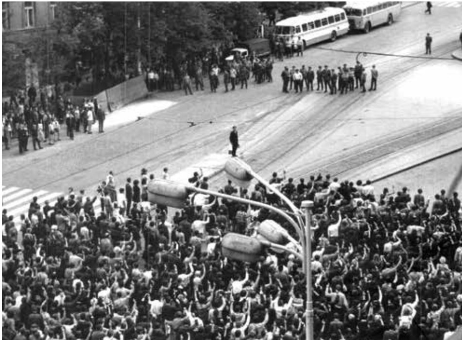
Lidé se po poledni 21. srpna 1969 shromáždili pod sochou sv. Václava na Václavském náměstí, aby zazpívali hymnu a složili slib