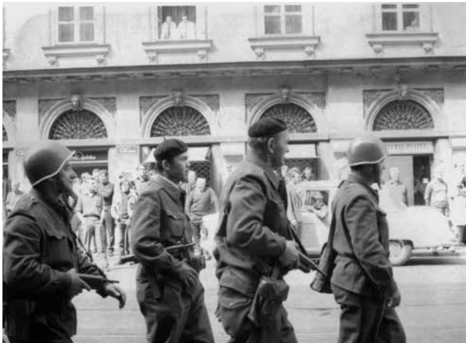
Příslušníci Lidových milicí vyzbrojení samopaly pochodují v centru Prahy po Národní třídě směrem k Jungmannově ulici