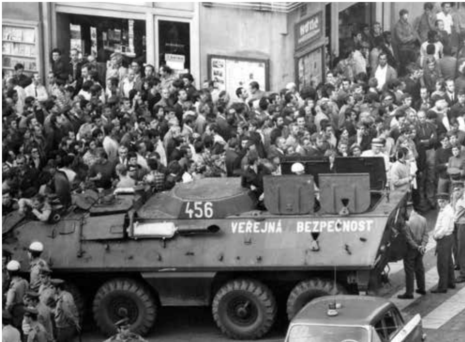
Policejní uzávěra Václavského náměstí odpoledne 19. srpna 1969