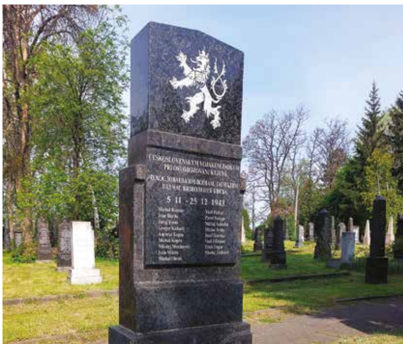
Památník padlým československým vojákům, bývalým vězňům Gulagu, na Ljukanivském vojenském hřbitově v Kyjevě