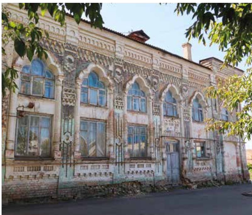
Nádražní budova ve Vasilkovu původně sloužila jako synagoga. Podle jedné z verzí událostí zde 9. 11. 1943 vojáci 1. československé samostatné brigády v SSSR našli nádobu s tekutinou, po jejímž požití zemřeli.