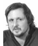
JAN DVOŘÁK (1982) se specializuje na problematiku politických represí vůči českým krajanům a československým občanům v SSSR

propaganda, nepřipouštěli. K tomu, aby k podobným projevům hlavně na veřejnosti nedocházelo, sloužila pojistka v podobě trestně-právního postihu. Přísnost vynesených trestů ale nehrála alespoň v uvedených případech tu nejdůležitější roli. Hlavním účelem potrestání všech doložených „hanobitelů SSSR“ bylo odradit je od dalšího vyjadřování se na adresu tohoto klíčového spojení komunistického Československa a všem ostatním potenciálním kritikům vyslat varovný signál, aby se o nic podobného raději nepokoušeli. Absence podobných případů u sledované skupiny bývalých vězňů Gulagu až do roku 1989 dokazuje, že se tito zkušení trestanci alespoň v tomto ohledu chovali obezřetně. Unikátní svědectví o sovětských represích se tak v Československu dostala na veřejnost až po roce 1989. PJ