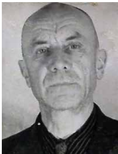
Po téměř 11 letech v sovětských lágrech se v roce 1956 vrátil do ČSR ruský předválečný emigrant Petr Savický. Už o pár let později se však měl i on dopustit trestného činu veřejného hanobení spojeneckého státu, samozřejmě znovu SSSR.

i předním ideologům až do své smrti patřil. To nikdy nešetřilo kritikou bolševiků a poměrů v SSSR. Právě kvůli meziválečným protisovětským aktivitám byl Savický v červnu 1945 osvoboditeli zatčen a převezen do Moskvy, kde byl za kontrarevoluční činnost odsouzen k 10 (někdy uváděno i 8) letům pobytu v nápravně pracovních táborech. Téměř celý trest strávil v jednom z táborů Dubrovlagu (Mordovie). Odsud byl také v dubnu 1955 propuštěn a žil v SSSR až do té doby, než se mohl v lednu 1956 vrátit k rodině do Prahy.