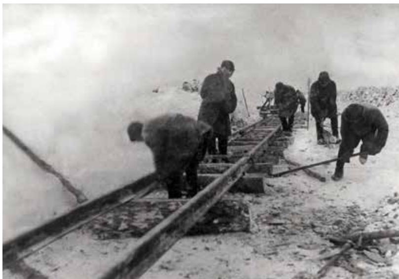
Pokládání kolejí u tábora č. 4 Sevzeldorlagu

pozn. 10), se objevila zpráva i v regionálním deníku Haná , sepsaná podle vyprávění jistého námořníka Grubeho: „Je to kostel vystavěný na vysoké skále, kam posílají provinilé trestance. Teplota tam ani v létě nedosáhne nuly. Trestancům tam nechávají jen košili a kalhoty. Teplou stravu jim dávají jednou za 3 dny. Jinak dostávají studenou kávu a půl funtu chleba. Sekyrka má ohromné rozměry. Napřič stojí v ní lavice, na níž trestanci musí celý den sedět. O čtvrté hodině ráno je budí k ranní modlitbě, jež se protáhne do pěti hodin večer a spočívá v tom, že trestanci se posadí na lavici a sedí nehnutě. Je jim zakázáno hovořit. Při sebemenších přestupcích stráž u stěny postavená střílí. Na noc nechávají trestancům jen košili. Aby nezmrzli, lehají si