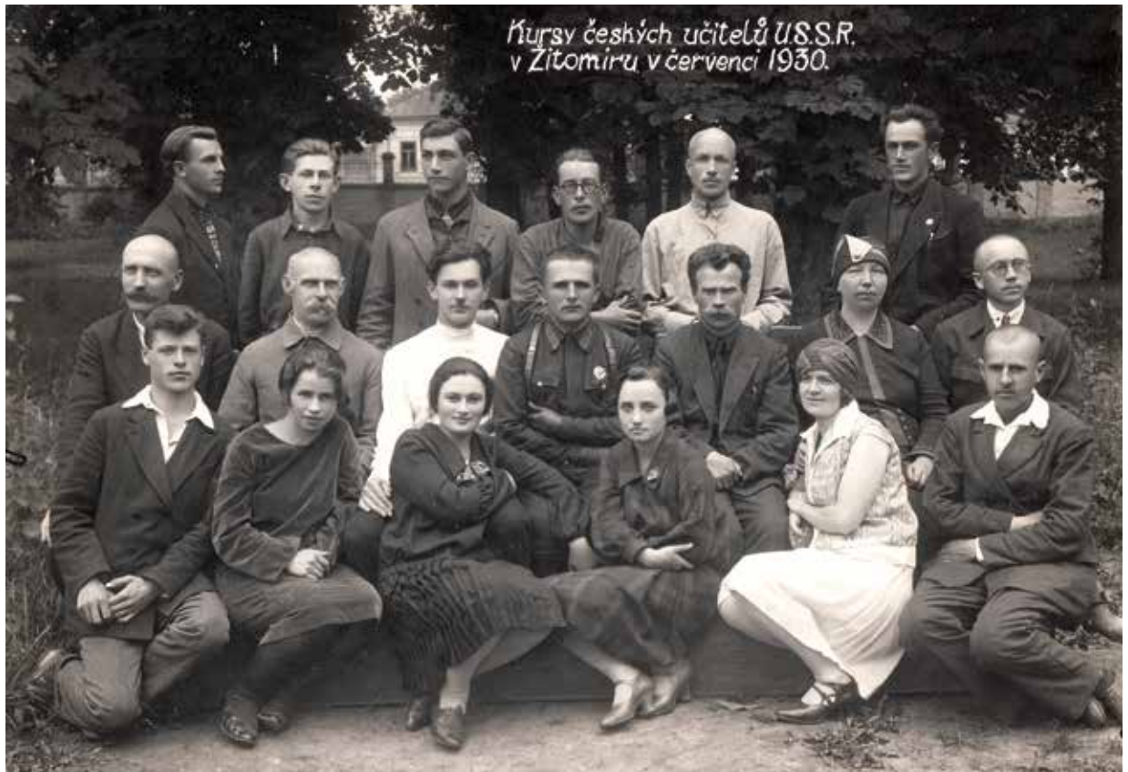
Kurzy českých učitelů se uskutečnily v Žitomíru v červenci 1930

Krátká zpráva o zatýkání se objevila již o rok dříve v Poledním listě nebo Lidových novinách : „11 profesorů, kteří měli styky s Prahou, zatčeno - Z Charkova se oznamuje, že GPU zatka dalších 11 profesorů, které obvinila, že pěstovali styky s profesorskými emigrantskými kruhy v Praze a v Berlíně.“ 49