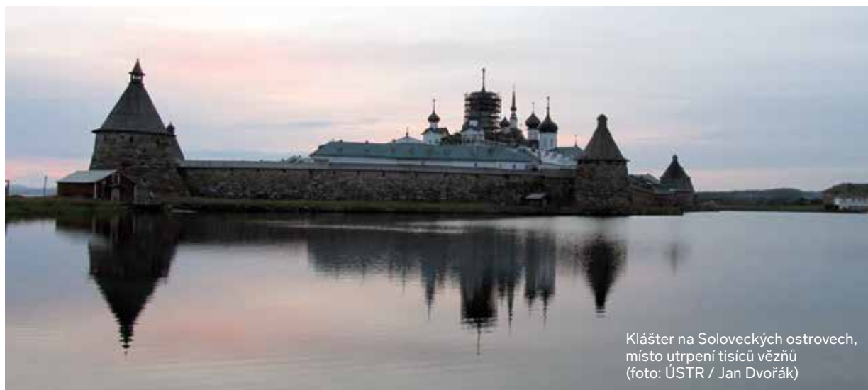
Klášter na Soloveckých ostrovech, místo utrpení tisíců vězňů

Přirozený vliv na četnost nalezených článků měla i samotná represivní politika sovětské vlády a Stalina. Po částečném uvolnění v období