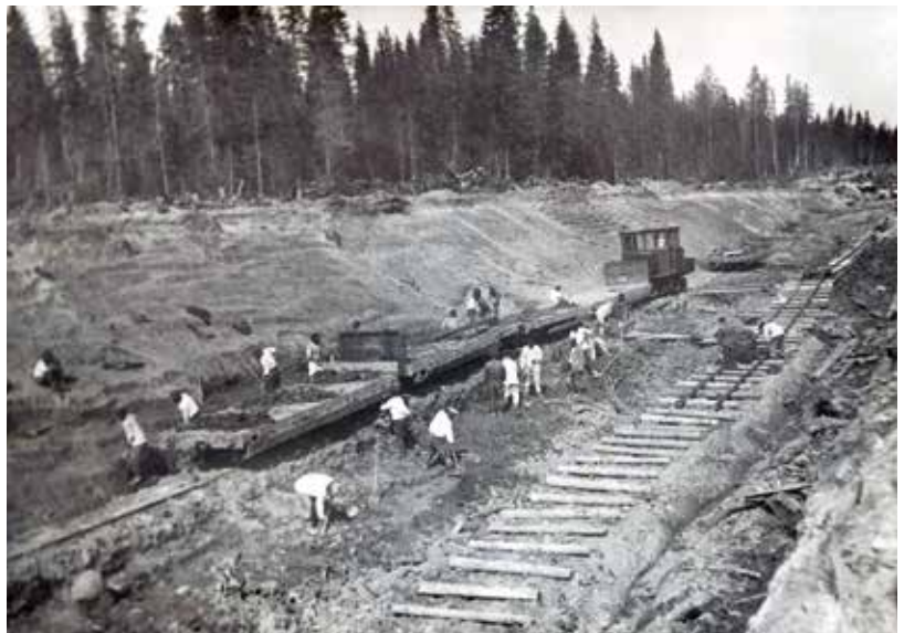
Věžní staví železnici

Jako zajímavosti si noviny povšimly detailu zákazu vánočních stromků: „Ve vánočních lidových časopisech bylo ukázáno, že protináboženská