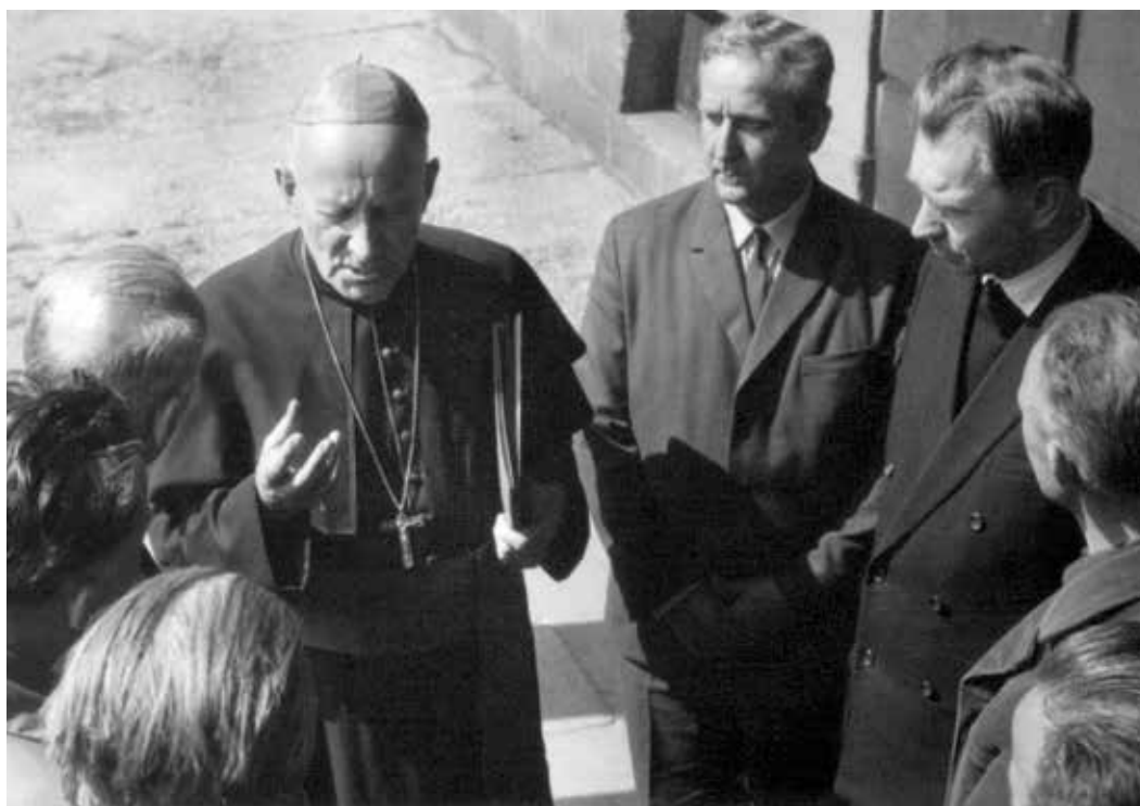
Schválení Akčního programu a stanov Díla koncilové obnovy O přestávce využili delegáti příležitosti promluvit s biskupem Tomáškem