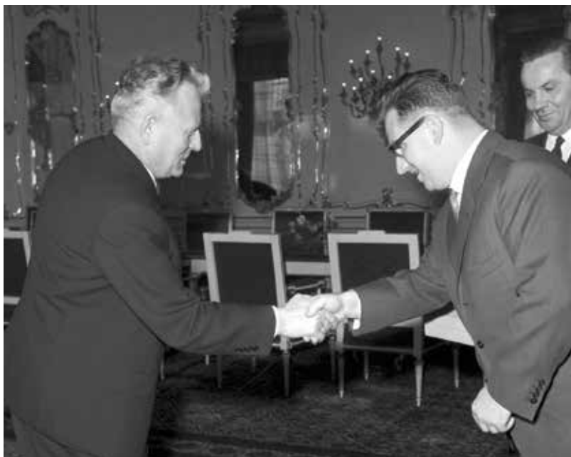
Lubomír Štrougal v čele delegace ministerstva vnitra blahopřeje Antonínu Novotnému k 60. narozeninám (1964). Jako dar přinesl malé krátkovlnné vysílačky.

Již v listopadu 1961 byla zahájena výměna na postech náměstků, na ně navázaly obměny na centrálních i regionálních správách. Někteří funkcionáři museli resort opustit úplně, v dalších případech došlo k personálním rošádám, naopak přicházely ze stranického aparátu posily. Změny ve vedoucích funkcích pokračovaly i nadále, z vedení operativních a krajských správ se přesunuly na nižší složky.