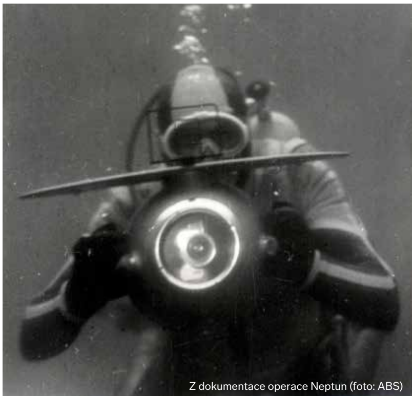
Z dokumentace operace Neptun

K tématu blíže viz CAJTHAML, Petr: Profesionální lháři (Aktivní opatření čs. rozvědky do srpna 1968). In: Sborník archivu ministerstva vnitra , č. 4. OABS MV ČR, Praha 2006, s. 9–41. Studie obsahuje také výstižný popis celé operace Neptun.