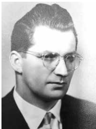
Lubomír Štrougal byl ministrem vnitra od 23. června 1961 do 26. dubna 1965

Štrougal sám post ministra vnitra srovnával s úlohou prezidenta a svůj nástup přirovnal k „cestě do neznáma“. 3 Lze věřit, že do funkce nastupoval bez znalosti problematiky i systému bezpečnostní práce, je ovšem těžko myslitelné, že by přicházel