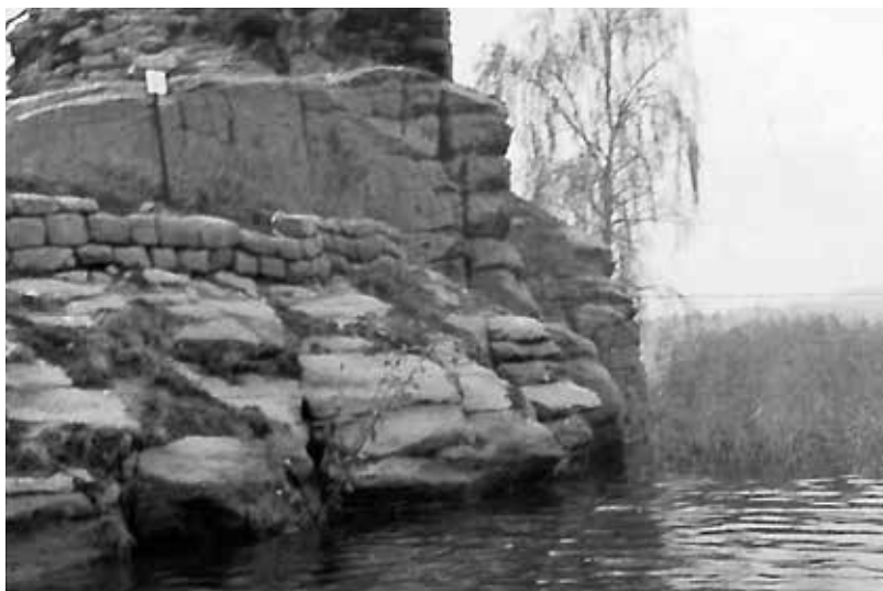
Úspěch operace Neptun podnítil StB k dalším aktivitám. Mezi prvními koncem roku 1964 proběhlo hledání údajného nacistického pokladu na ostrově Racků (ostrov Myšlín) na Máchově jezeře.

K tomu nedošlo, konference skončila ohromným úspěchem a měla značný ohlas po celém světě. Při jejím zahájení ministr uvedl: „Získané dokumenty nám usnadnily zkoumání dalších písemností, objasnění některých