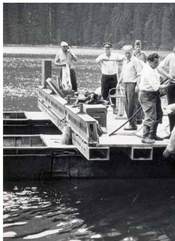
Akci Neptun sehrála StB tak věrohodně, že příběhu o nalezení nacistických dokumentů na dně Černého jezera uvěřila i západní média. StB si celou akci velice podrobně dokumentovala.