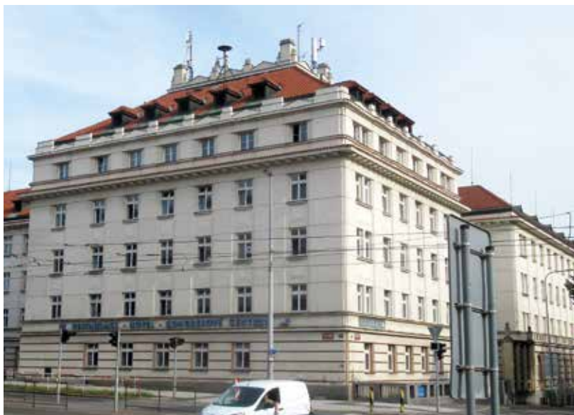
Komplex v Sadové (dnešní Thákurově) ulici byl vybudován v době první republiky jako vysokoškolské koleje. Za druhé světové války zde byly kasárny pro nacistický Wehrmacht, po válce krátce znovu koleje. Na počátku 50. letech objekt obsadila Státní bezpečnost, která zde působila až do roku 1990.

děli mj. o chystaném mimořádném XIV. sjezdu KSČ ve Vysočanech.