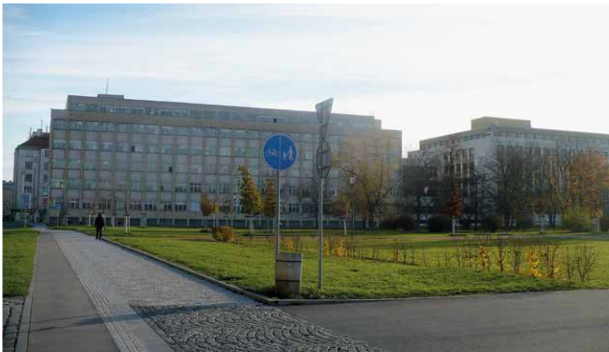
Objekt na pražské Letné, podle obložení stěn lidově nazývaný „Kachlíkárna“, byl vystavěn ve druhé polovině 30. let pro ministerstvo vnitra. Sídlilo zde vedení včetně náměstků, správa kádrů, inspekce apod. Nebyly zde umístěny téměř žádné součásti Státní bezpečnosti.