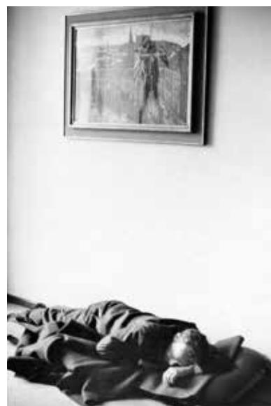
Sovětská vojáci a obrněná technika u budovy Národního shromáždění. V srpnových dnech se spalo, doslova kde a na čem se dalo. Odpočinek v předsíni pracovny předsedy Národního shromáždění.

většina z nich tak činila podle rozkazu nadřízených bez vědomí toho, že pracují proti své vlasti. V rozhovorech s novináři upozorňoval na to, že kolaboranti se znemožnili sami, varoval ovšem před nadměrným užíváním slova kolaborant s tím, že mnoho z pracovníků StB jednalo z nevědomosti. V rozhovoru pro rozhlas jménem branného a bezpečnostního výboru apeloval na příslušníky Státní bezpečnosti slovy, že „každý zvlášť si musí v této chvíli uvědomit svou odpovědnost a uvědomit si to, že náš lid bude naše činy těchto dnů posuzovat přísně [...] a bezpečnostní výbor vám, soudruzi, důvěřuje, že se nepropůjčíte k ničemu, k žádnému činu, za který bychom se museli stydět.“ 29