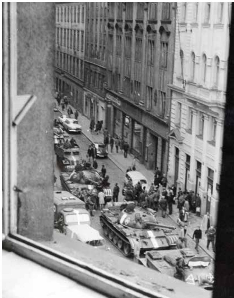
Takovýto výhled měli poslanci z budovy Národního shromáždění 23. srpna 1968

aby do Moskvy odjela další zvláštní konzultační skupina, nebo aby delegace přerušila jednání a vrátila se na nějaký čas domů. Prezident a ostatní (včetně internovaných politiků) se nakonec ze SSSR vrátili 27. srpna po podpisu tzv. moskevského protokolu, který dodatečně legitimizoval okupaci a stál na počátku „normalizace“ situace. Dokument byl ovšem tajný, ani poslanci neznali jeho