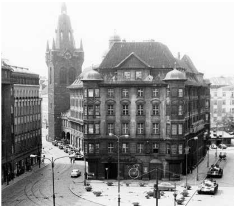
V době rekonstrukce budovy Národního shromáždění sídlilo jeho předsednictvo a aparát v tzv. Cukrpaláci na Gorkého náměstí (dnes Senovážné), kde jim byla vyhrazena menší část přízemí a první a druhé poschodí

Na přelomu let 1967/1968 se ovšem do zorného pole poslanců znovu dostaly i záležitosti týkající se bezpečnostní problematiky. Jednalo se zejména o tzv. strahovské události a o aféru kolem osoby generála Šejny. Dne 31. října 1967 vyšli studenti ze strahovských kolejí do ulic na protest proti opakujícím se výpadkům elektřiny. Na Malé Straně je za použití gumových obušků a slzného plynu brutálně rozehnala Veřejná bezpečnost (VB), v násilnostech pokračovala i na vysokoškolských kolejích, čímž porušila uznávanou akademickou