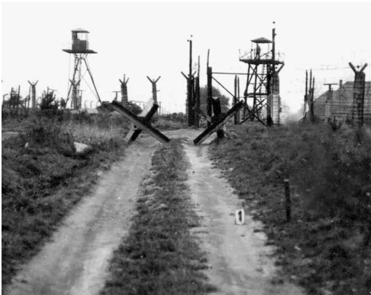
Ženíjně-technické zabezpečení státní hranice. V popředí je cesta přehrazena tzv. jezky, v pozadí stojí signální stěna a dvě pozorovatelný. Českobudějovická brigáda PS, rota Artoleč (1976).