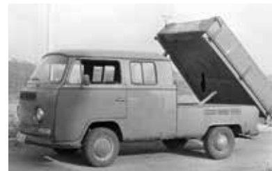
V roce 1981 se pokusili překročit státní hranici s Rakouskem občané NDR Lothar Schmidt a Arthur Rippel, kteří se po domluvě ukryli v prostoru nádrže automobilu Volkswagen

na hranicích postupně zmírnil. Než k tomu došlo, přišel listopad 1989.