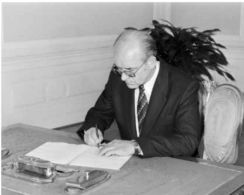
Vratislav Vajnar při svém jmenování do funkce ministra vnitra 20. června 1983