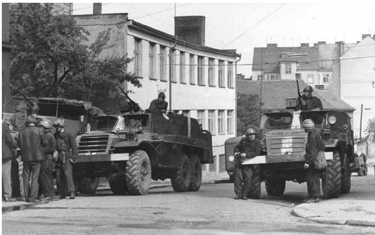
Sovětská vojska s obrněnými transportéry BTR-152 hlídají u tiskárny Pravdy v Plzni v srpnu 1968