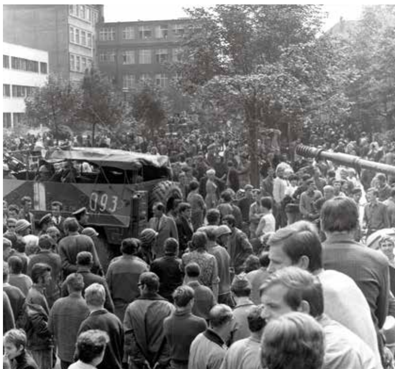
Shromáždění občanů před budovou Čs. rozhlasu na náměstí Míru v Plzni v srpnu 1968. Vlevo je vidět sovětský obrněný transportér BTR-152 a vpravo kanon tanku T-10. Dole současný stav.