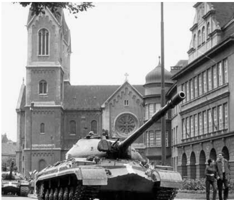
Tanky T-10 projíždí přes Chodské náměstí v Plzni, srpen 1968. V pozadí je vidět kostel sv. Jana Nepomuckého.