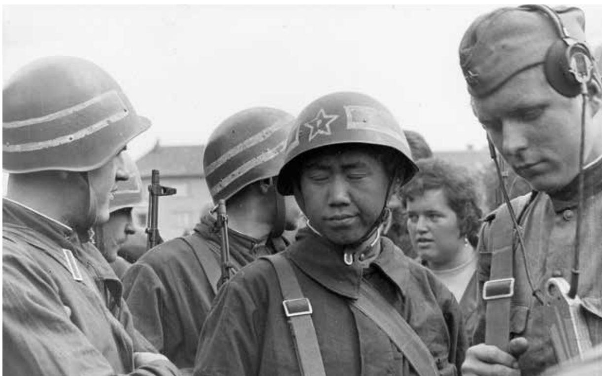
Sovětsí vojáci v centru Plzně v srpnu 1968

pracoviště skupiny. Náčelník skupiny mi uložil zabalit veškeré důležité dokumenty, agenturní svazky do jutového pytle, ten opatřit jmenovkou a předat ho adm[inistrativnímu] důstojníkovi s[oudruhu] Bejvančickému. Splnění úkolu jsem ohlásil a obdržel pokyn vyčkat dalších pokynů v bydlíšti. Kromě výzev, abych na pracovišti držel službu, jsem jinak využit služebně nebyl. 14