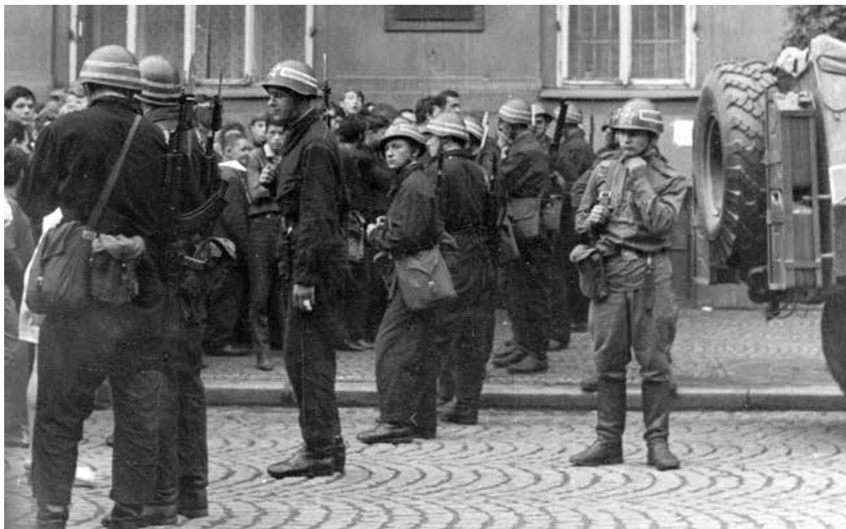
Sovětsí vojáci na Klatovské třídě blokují přístup občanů ke vchodu na Posádkovou správu Plzeň, kde měli v srpnu 1968 kanceláře příslušníci 1. skupiny 1. oddělení 248. provozního praporu. Mezi okny je vidět část pamětní desky obětem 2. světové války.