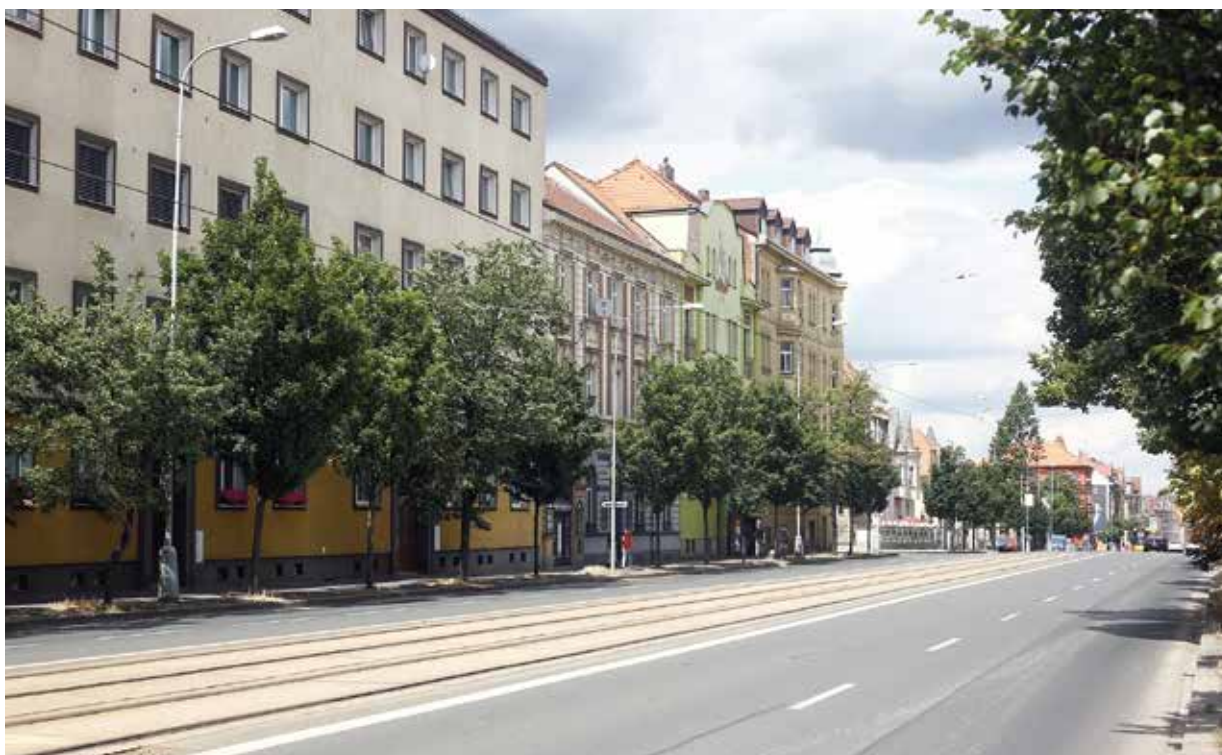
Invazní tanky na plzeňské třídě 1. máje v srpnu 1968 a stejné místo dnešní Klatovské třídy na současné fotografii