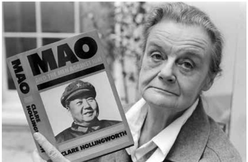
Britský výbor pro uprchlíky z Československa zastupovala v Polsku budoucí slavná válečná korespondentka Clare Hollingworthová (1911–2017)