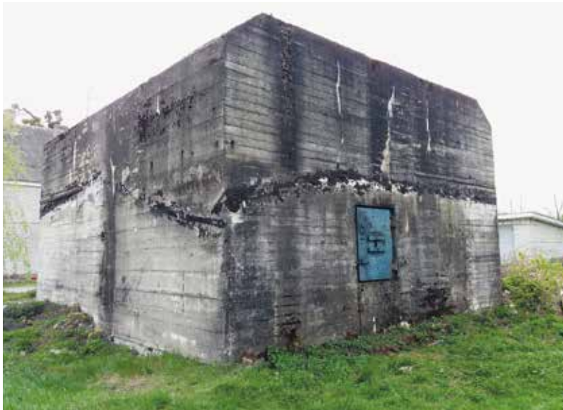
Jedna z dochovaných budov Himmlerova hlavního stanu v kolonii Hegewald (oblast Žytomyr)

počtu tvořily děti ve věku od šesti do osmnácti let, celkem to bylo oněch 90–100 tisíc osob.