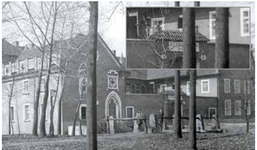
Fotografie z webových stránek Veltrusy.net a její výřez, jež mají dokazovat působení spolku Lebensborn na zámku Veltrusy. Ve skutečnosti fotografie dokládá využívání areálu zámku projektem Kinderlandverschickung .

Zdroj: LILIENTHAL, Georg: Der „Lebensborn e. V.“. Ein Instrument nationalsozialistischer Rassenpolitik , s. 8–9; HRUBEŠOVÁ, Zuzana: Okupace a Roudnice. Spisy Mimořádného lidového soudu Litoměřice (1945–1948) jako pramen pro poznání protektorátní každodennosti v Roudnici nad Labem . (Diplomová práce). Technická univerzita v Liberci, Fakulta přírodovědně-humanitní a pedagogická, Liberec 2018, s. 27.