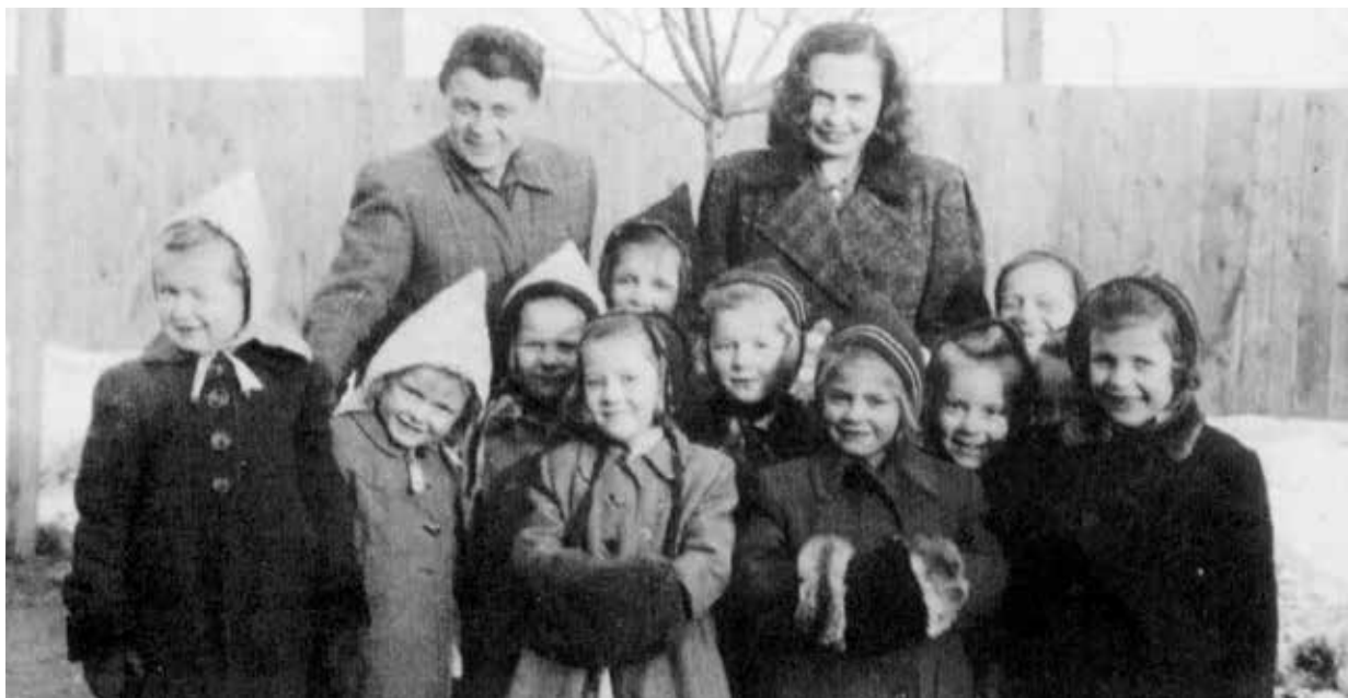
Skupinka dětí internovaných v letech 1944–1945 v táboře ve Svatobořicích

shledáno jako vhodné k poněmčení. Dne 14. dubna 1944 děti z Jenerálky převezli do internačního tábora ve Svatobořicích u Kyjova. Tam byly od podzimu 1942 soustředěny osoby zadržené jako příbuzní emigrantů