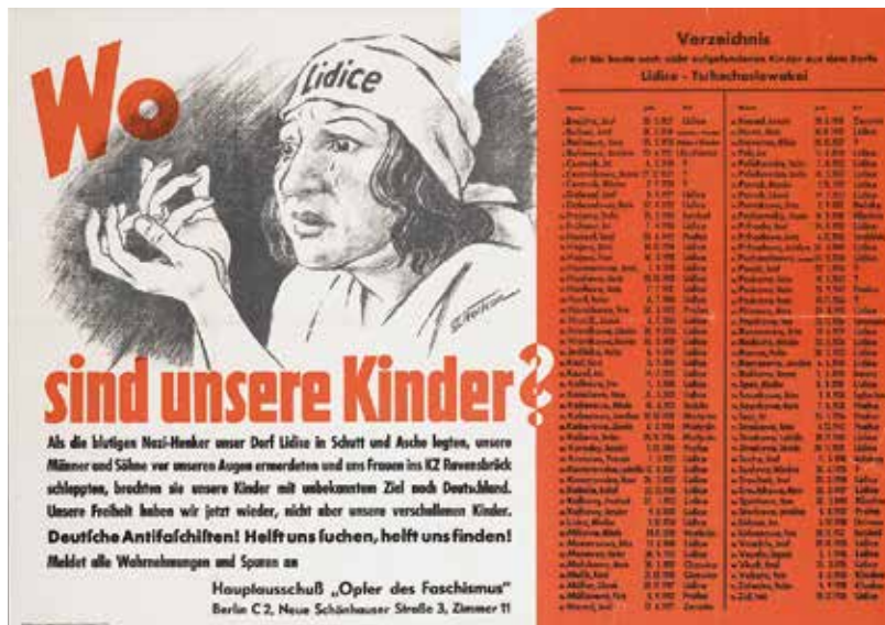
Plakát z roku 1945 „Wo sind unsere Kinder?“ (Kde jsou naše děti?). S pátráním po lidických dětech pomáhaly i německé antifasistické organizace.

a ukrývajících se odbojářů. Děti tu byly od ostatních vězňů izolovány a podléhaly zvláštnímu režimu. Koncem války je nakrátko přemístili do školy v Kyjově a po likvidaci tábora v dubnu 1945 s částí dalších vězňů převezli do Brna a pak do pracovní-výchovného tábora v Plané nad Lužnicí, kde se dočkaly osvobození. 15