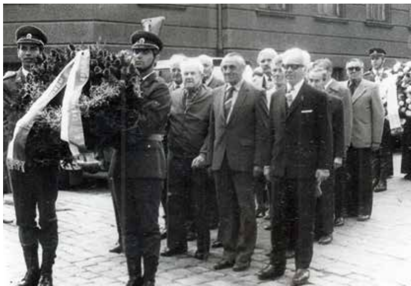
Oficiální oslavy u krypty v Resslově ulici v osmdesátých letech 20. století. Za vojáky čestné stráže s věncem stojí veteráni výsadkových operací – bez uniforem a vyznamenání, mnozí degradovaní a se záznamem v trestním rejstříku.

Odvolací líčení se konalo 27. února 1969 u Krajského soudu v Hradci Králové a za žalobce k němu byl pozván pouze JUDr. Tichý. Před zahájením vyzval předseda senátu strany k uzavření smíru podle části návrhu formulovaného dr. Tichým 27. srpna. Body, v nichž se hovořilo o okupaci Československa, již do něj zahrnuté nebyly. Formulace, kterou navrhla žaloba, zněla: „1) Uznáváme tímto, že obsah knihy Údolí výstrahy je nejen v rozporu s historickou pravdou, ale že [je] objektivně schopen dotknout se cti žalobců. 2) Žalobce považujeme za přední hrdiny našeho národně osvobozeneckého boje a omlouváme se jim za vše, čím jsme mohli jejich zásluhy snížit, nebo dokonce popřít.“ 26 Jägermann