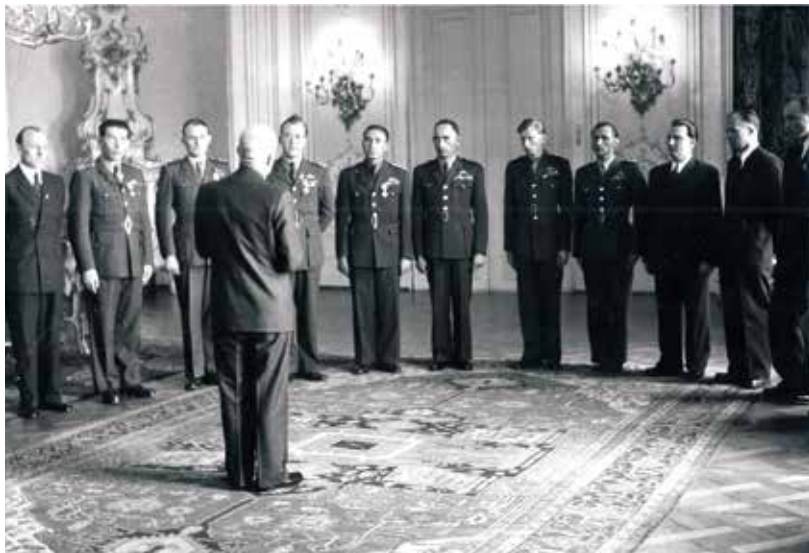
Audience přeživších parašutistů ze Západu u prezidenta Edvarda Beneše na Pražském hradě