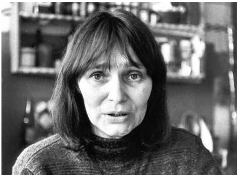
Dana Němcová před zatčením v roce 1979

Dne 11. dubna 2023 zemřela v devětaosmdesáti letech psycholožka a disidentka Dana Němcová. Poslední rozloučení se o jedenáct dnů později konalo v kostele sv. Ignáce na pražském Karlově náměstí, který se nachází nedaleko místa, kde Dana Němcová prožila většinu svého života. Byt rodiny Němcových v Ječné ulici č. 548/7 byl již od šedesátých let jedním z center protirežimní opozice a byl otevřen všem hledajícím.