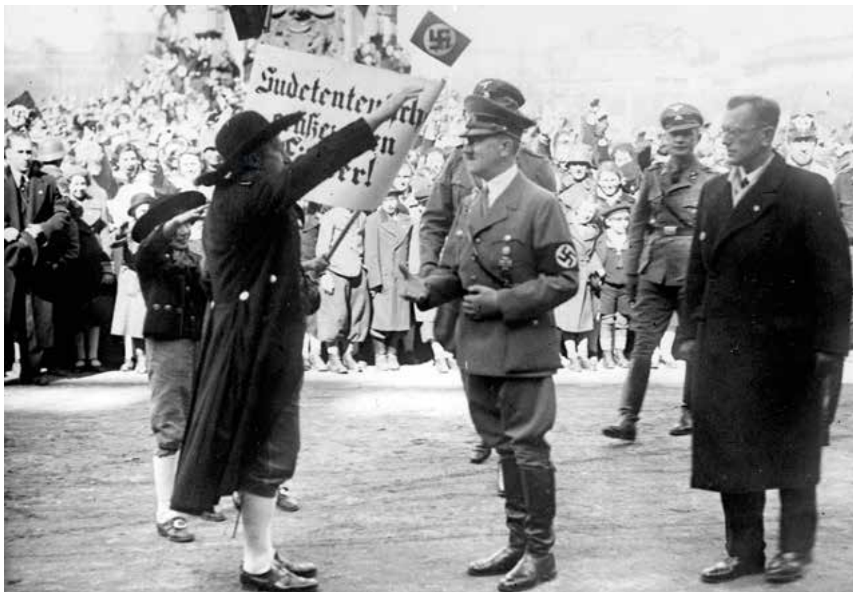
Hitler dorazil do Vídně 14. března 1938 a následující den vyhlásil na náměstí Heldenplatz za jáso tu přibližně 250 tisíc lidí „vstup své vlasti do Německé říše“. Na snímku zdraví Hitlera a rakouského nacistu Arthura Seyß-Inquarta skupina českých Němců.

oddíly SS rozkaz, aby vyrazily k synagogám a zdemolovaly je. Pogrom proti židovskému obyvatelstvu a jeho majetku byl pečlivě naplánován a značná část populace ho přijímal a dokonce se stala jeho hnací silou. Štvánice, násilnosti a „arizace“ se navíc neomezily pouze na tyto dva dny. Během listopadového pogromu bylo jen ve Vídni zabito nejméně 27 Židů, 88 osob bylo těžce zraněno, desítky dalších spáchaly sebevraždu a došlo k 6 500 zatčením. Celkem 3 700 zatčených Židů bylo deportováno do koncentračního tábora Dachau. Bylo vypleněno na 4 000 obchodů, vyrabováno 2 000 bytů a 42 synagog a modliteben lehlo popelem. Rovněž v okrese Döbling došlo k vymáčení výkladních skříní židovských obchodů a vyplenění jejich prostor,