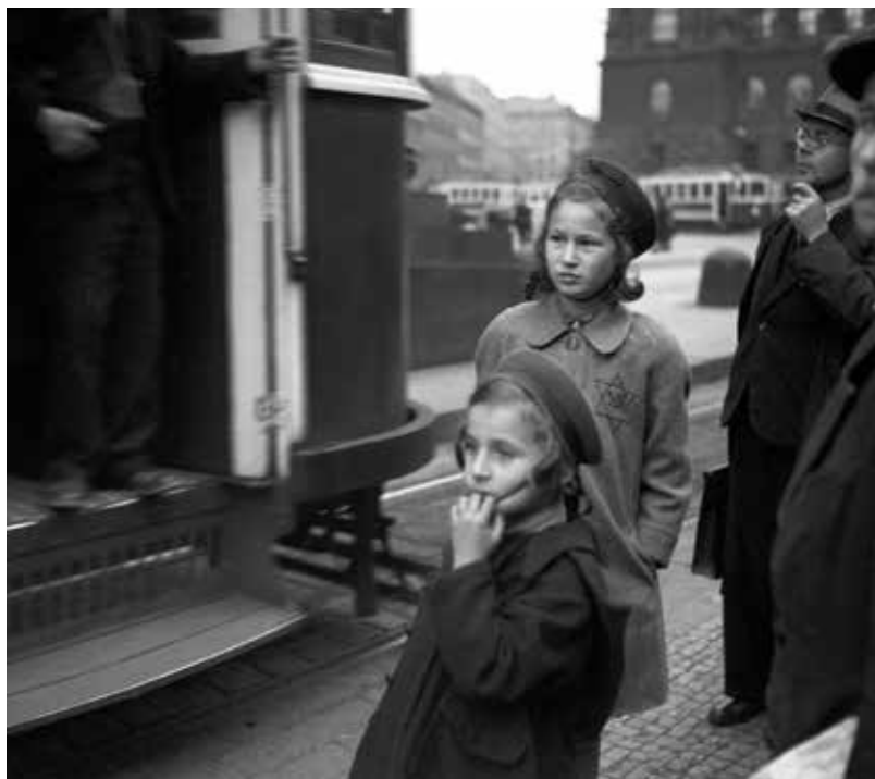
Opatření přijatá na podzim 1940 prakticky vytlačovala české Židy do „ghetta beze zdí“

přímo s Eichmannem ať už ve vídeňské, nebo v pražské ústředně. Když nastoupil do Prahy, úřad fungoval již více než rok. Tehdy se situace pro židovské obyvatelstvo v Protektorátu Čechy a Morava výrazně zhoršila.