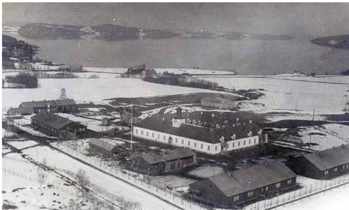
Trestný tábor SS Falstad, ústřední zděná budova fungovala původně jako polepšovna

V létě 1941 si důstojníci SS přišli prohlédnout budovu v zemědělské vesnici Ekne přibližně sedmdesát kilometrů severovýchodně od Trondheimu. Údajně hledali místo pro zřízení domova spolku Lebensborn, tedy domova pro rasově cenné matky a děti. V Ekne fungovala již od roku 1895 polepšovna Falstad pro mladistvé kárance. Počátkem dvacátých let byla rozšířena o zděnou budovu o čtyřech křídlech obklopujících ústřední nádvoří. 9 Budova byla původně určena pro plánované zvláštní oddělení. A právě tu si přišli prohlédnout důstojníci SS z Trondheimu. Od podzimu 1941 zpřísnila okupační moc opatření proti norskému obyvatelstvu, aby potlačila