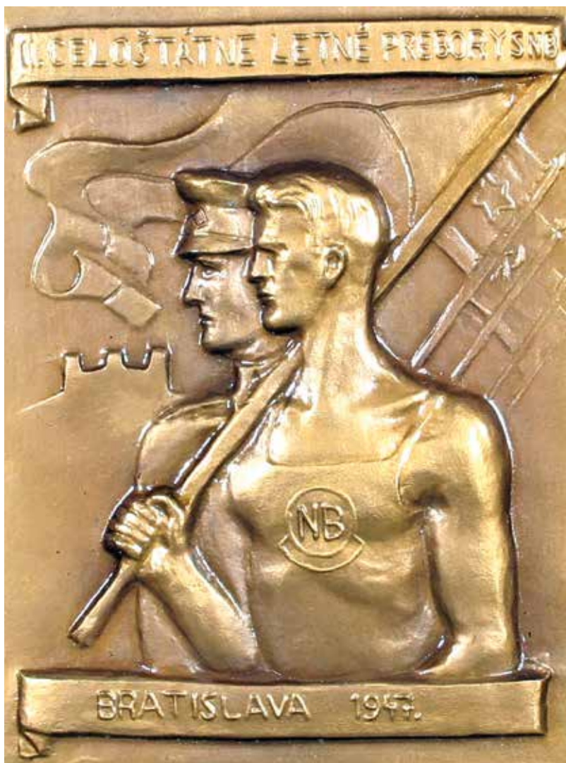
Na přeborech se neudělovaly medaile, ale plakety. Zde za třetí místo v plaveckém závodě v Bratislavě roku 1947.

Klání skončilo v neděli 15. září slavnostním nástupem všech účastníků a předáním ceny ministra vnitra absolutnímu vítězi. Díky mohutnému finiši zvítězilo mužstvo Čech před Moravou a Slovenskem, na posledním místě skončili reprezentanti Pohotovostního útvaru. Václav Nosek v závěrečné řeči prohlásil, že není důležité umístění, ale to, že se příslušníci Sboru národní bezpečnosti osvědčili jako celek. Zdůraznil, že služba v SNB je obtížná a důležitá,