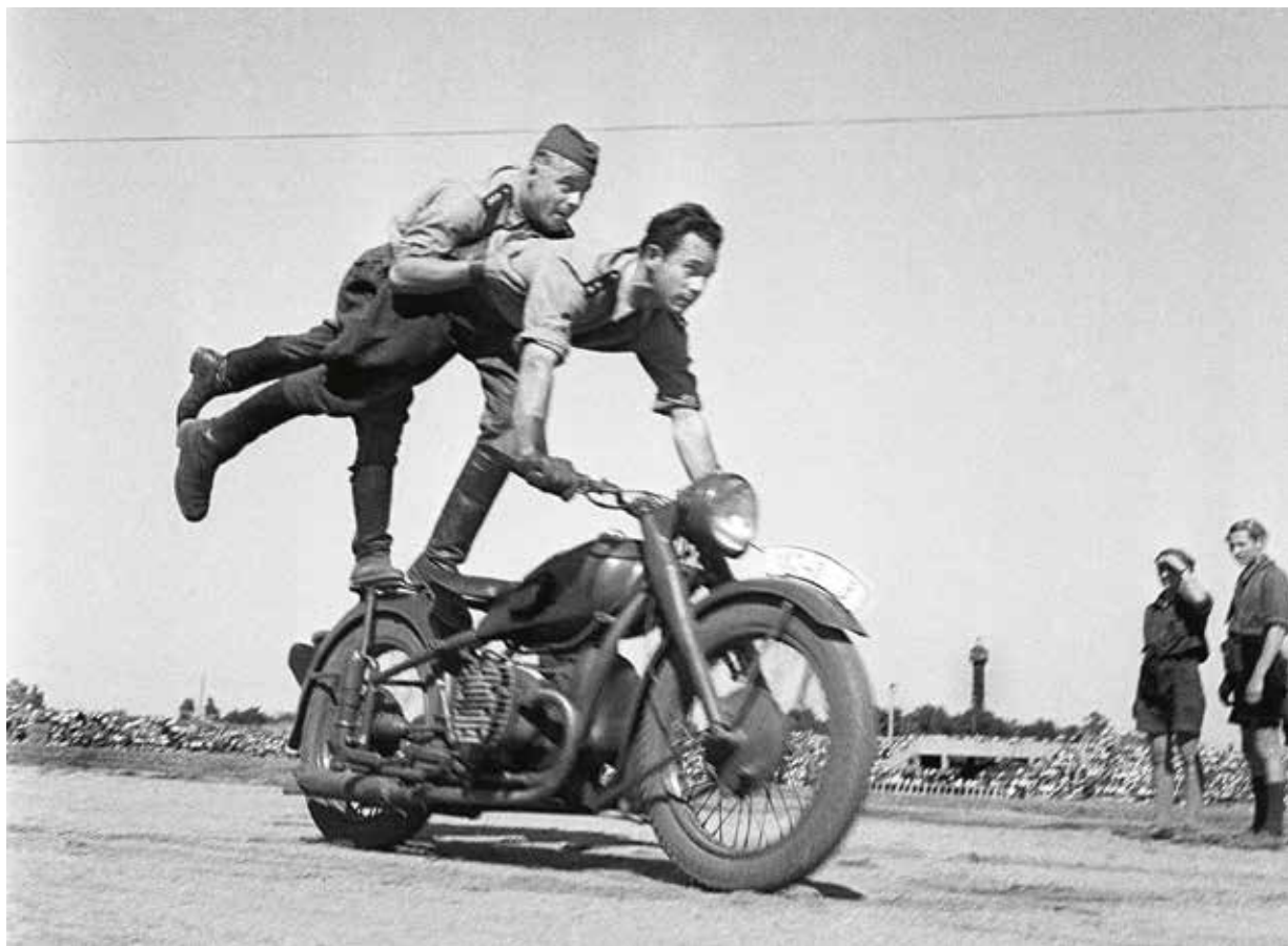
Příslušníci Sboru národní bezpečnosti museli být ve druhé polovině čtyřicátých let tělesně zdatní, řada z nich se věnovala nějakému sportu. Vystoupení motorkářů SNB na Dni radosti a bratrství, který se konal na sletovém stadionu na Strahově v rámci Světového festivalu mládeže a studentstva 15. srpna 1947.