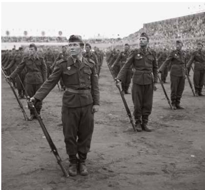
Spartakiády se účastnili také příslušníci největší ozbrojené složky, Československé lidové armády

Podle původního rozhodnutí kolegů jako nejvyššího poradního orgánu