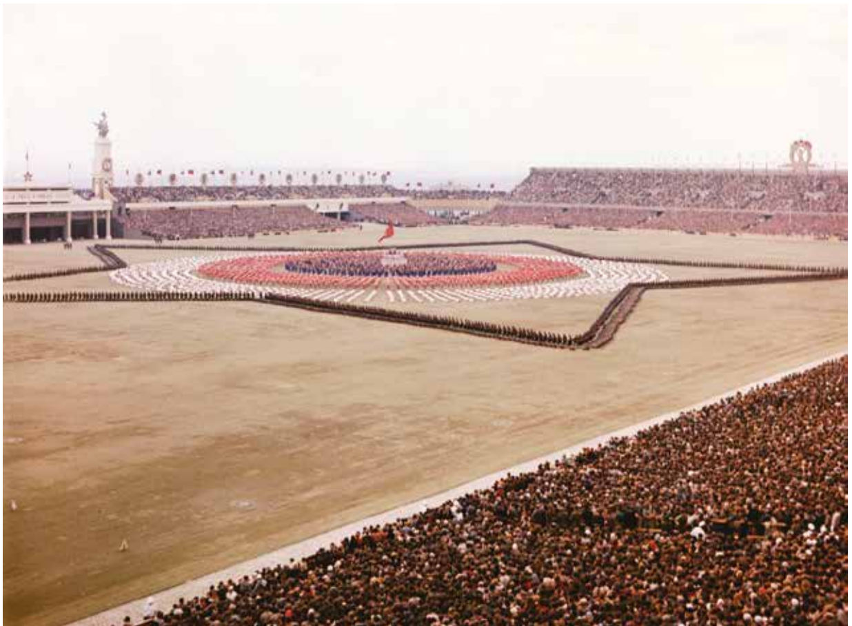
Efektní závěrečné vystoupení, soustředné kruhy v národních barvách, obklopené pěticípu hvězdou, v níž v první řadě leželi příslušníci Pohraniční stráže a v druhé stáli vojáci Civilní obrany a Vnitřní stráže s namířenými zbraněmi. Sestava měla symbolizovat dík Sovětskému svazu za osvobození a připravenost k obraně vlasti, zbraně namířené směrem k publiku ale v některých vyvolávaly nepříjemné pocity.

ministra vnitra měli příslušníci bezpečnostních složek poprvé veřejně vystoupit až na samotné spartakiádě. Vzhledem k nutnosti porovnat stupeň nácvičku a spolupráce (oficiálně ovšem „za účelem prohloubení spolupráce s pracujícím lidem a ostatními sportovci“) svolil ministr k účasti cvičenců příslušných jednot na krajských, případně okresních spartakiádách,