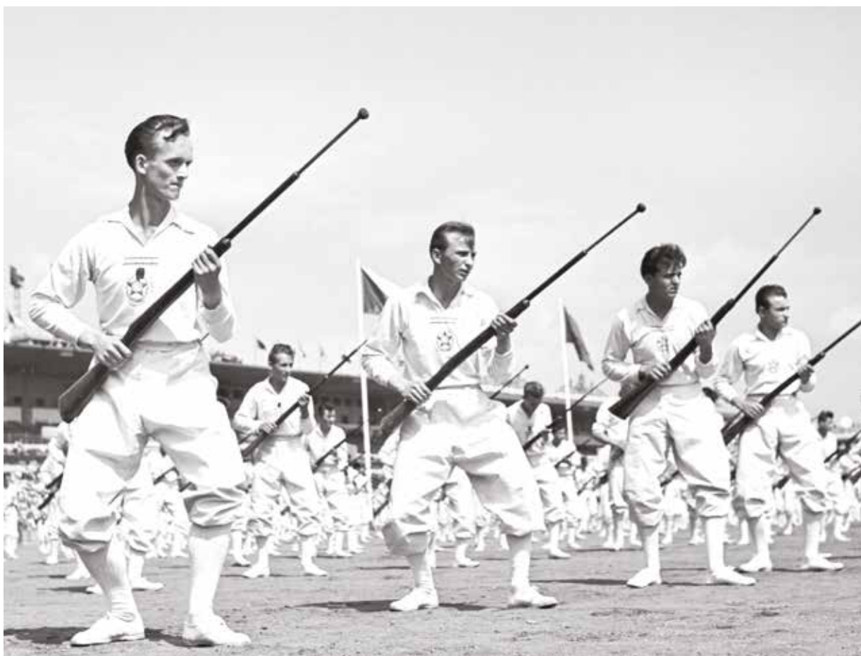
Nový rozměr masové tělovýchovy. Členové Svazu pro spolupráci s armádou (Svazarm) cvičí na I. celostátní spartakiádě s bodáky na puškách.

šerm bodákem nasazeným na pušce, na stadionu objevili nejen parašutisté a cvičení psi, ale přijely i motocykly či traktory. Poslední den I. celostátní spartakiády potom nesl název Den ozbrojených sil. Zahajovalo ho vystoupení Dobrovolné sportovní organizace Rudá hvězda (DSO RH) a vojsk Ministerstva vnitra (MV).