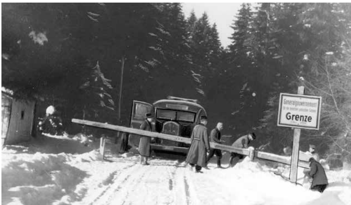
V září 1939 byla ke Slovensku připojena i původní polská území Oravy a Spiše. Hraniční přechod mezi Slovenskem a Generálním guvernémentem v Muszyně.

stav oddílu zvyšovat, a to ovlivnilo i jeho aktivity. „ Partyzáni vedení ‚Mścicielem‘ stále častěji prováděli rekvizice a likvidace spolupracovníků Bezpečnosti na území nowotargovského a myšlenického okresu. “ 31 Mnoha z těchto akcí se zúčastnili i bratři Samborští. Rozsah této činnosti lze znovu přiblížit prostřednictvím souhrnných údajů Ministerstva národní bezpečnosti. Za rok 1947 bylo v Krakovském vojvodství evidováno celkem 619 přepadů (z toho 165 „terroristických“), jejichž cílem byli mj. příslušníci MO (34), UB (11), armády (12) či členové PPR (30). Zbývajících 454 přepadů bylo klasifikováno jako loupežné, týkající se nejčastěji