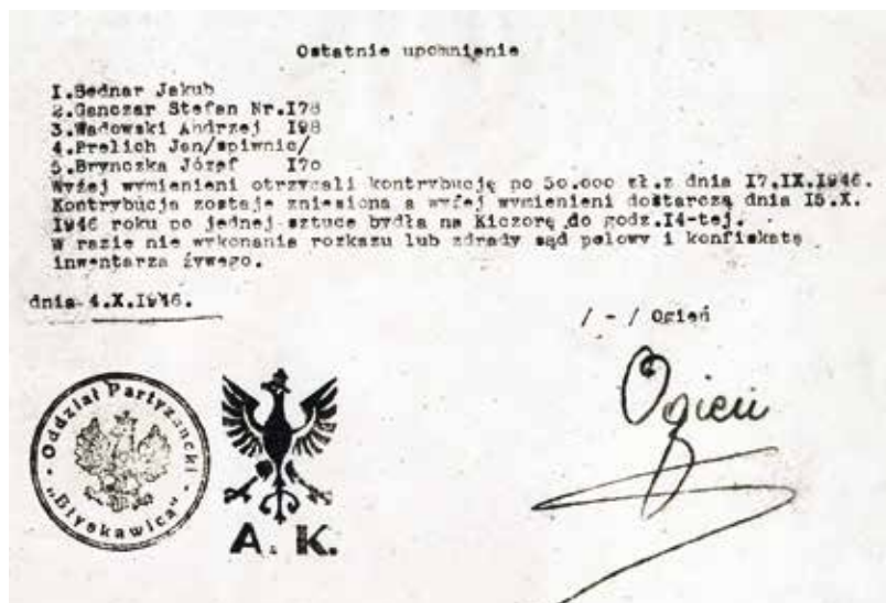
Kopie „posledního varování“, které měl vystavit oddíl Błyskawica. Uvedení hospodářů měli zaplatit kontribuci ve výši 50 000 zlotých, v případě odmítnutí jim hrozil polní soud a konfiskace majetku.

podporovali dobrovolně, docházelo i k vynucování dodávek zásob a jejich násilnému vymáhání. Jedno z hlášení polské armády týkající se činnosti protikomunistických skupin obsahuje kupříkladu informace o vesnici, v níž se příslušníci oddílu Błyskawica domáhali většího množství potravin, dobytka, peněz a dalšího materiálu. „Za nesplnění výše uvedeného banda pohrozila obyvatelům vesnice pohnáním k odpovědnosti.“ 19 Zejména pravicové spektrum odboje se v rekvizicích nezřídká zaměřovalo na ukrajinské, běloruské či právě slovenské obyvatelstvo. V prvních dvou případech měl tento postup pramenit z prorežimního postoje národnostních menšin. Vedle zabírání majetku čelili někteří Slováci i výhrůžkám, které leckdy neskončily pouze u slov – například v obci Nowa Biała byli zabiti čtyři muži slovenské národnosti. 20 Podle zprávy zvláštního pozorovatele československé vlády „dňa 15. apríla 1946 prišiel ve večerných hodinách do obce Nová Bela (Horný Spiš) oddiel poľského vojska v sile asi 70 mužov. Čiastka z nich obštúpila obec a ostatní pod vedením miestneho starostu Jána Ricyra [...] začali robiť domové prehliadky podľa vopred pripraveného zoznamu. Za tento večer vyrabovali poľskí vojaci úplne 6 slovenských usadlostí a odvieďli zo sebou 4 otcov rodiny, a to Jána Ščurka, Jozefa Chalupku, Jána Kraka a Jána Labšanškého. O ich ďalšom osude nie je nič známe.“ 21 Část polské historiografie má tendenci tyto kontroverzní činy omlouvat tím, že „dokonce v době