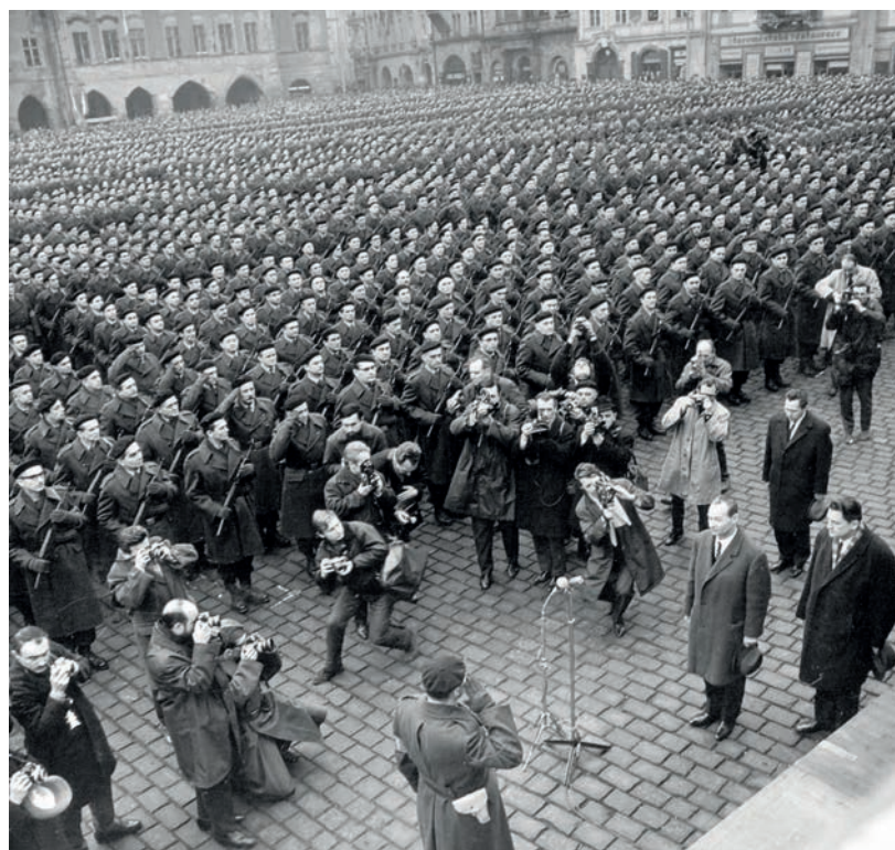
První tajemník ÚV KSČ Alexander Dubček při přehlídce LM. Jeho politika však v očích některých milicionářů „výdobytky Února“ ohrožovala.

službu, měla být mj. vyplacena náhrada za stravné, a to v celkové výši do dvou milionů korun. S podobnou sumou se počítalo i pro následující rok. 14 Jak dnes víme, právě v souvislosti s prvním výročím srpnových událostí v roce 1969 sehrály Lidové milice klíčovou roli a znovu se nelichotivě zapsaly do dějin.