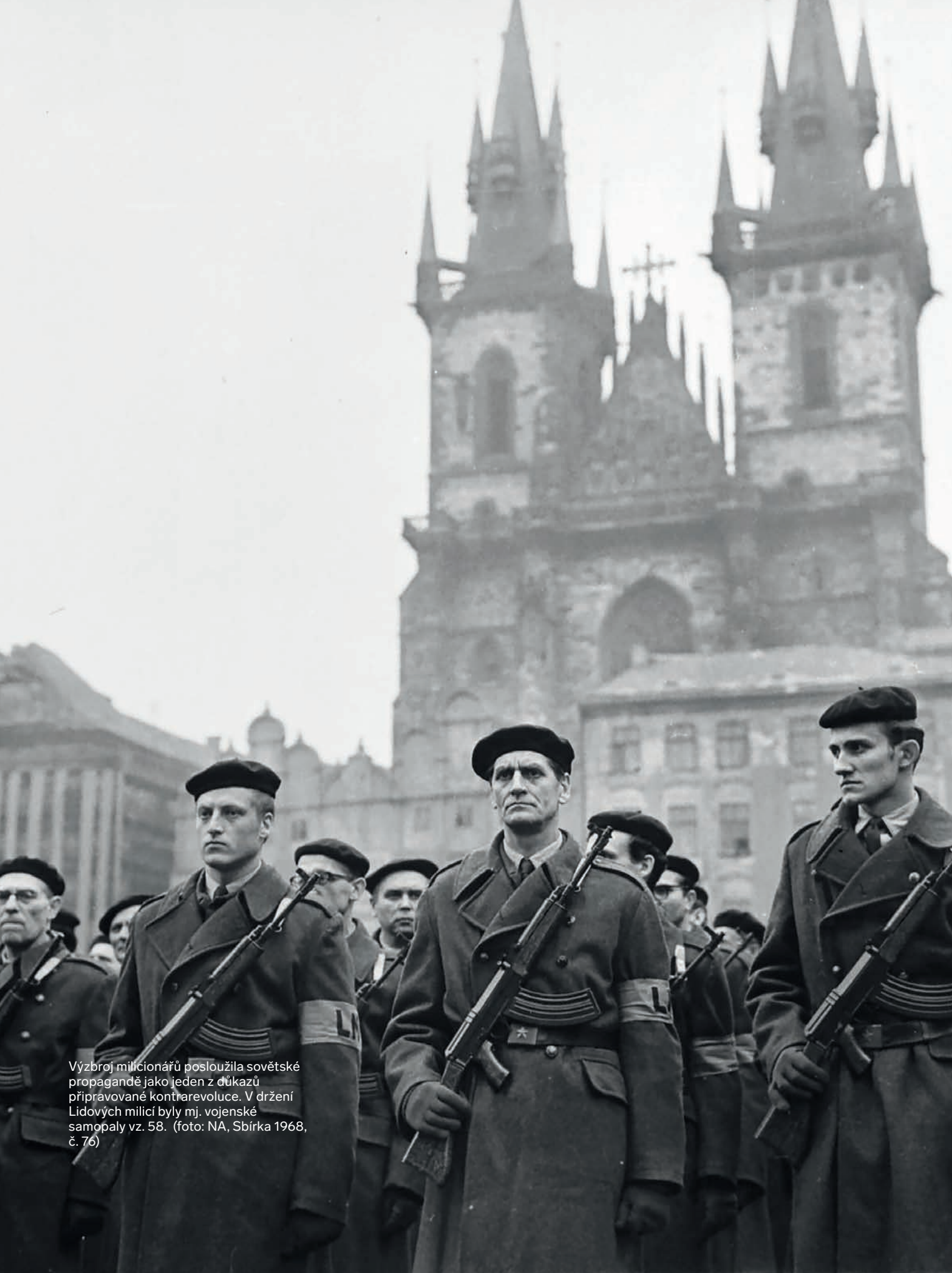
Výzbroj milicionářů posloužila sovětské propagandě jako jeden z důkazů připravované kontrarevoluce. V držení Lidových milicí byly mj. vojenské samopaly vz. 58.