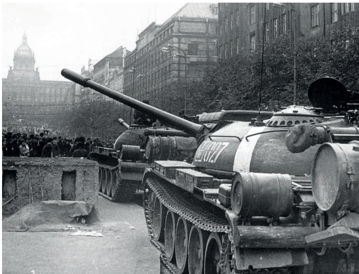
Někteří milicionáři přijali vpád pěti armád Varšavské smlouvy v čele se Sovětským svazem s úlevou, jiní v něm viděli agresi a okupaci země

Výzbroj „ozbrojené pěsti“ KSČ nicméně posloužila sovětské propagandě jako důkaz o chystané kontrarevoluci. Kromě zmínek v tisku a v nejrůznějších pamfletech byly pořizovány i filmové záběry, což dokládá i editovaný dokument. Pro řadu milicionářů to pochopitelně