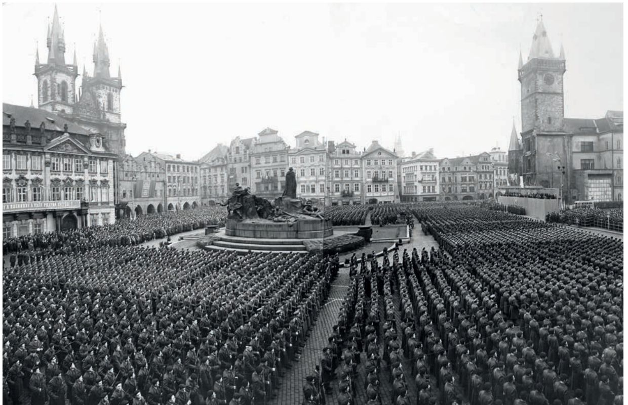
Lidové milice stály u zrodu vlády KSČ a svou roli hrály i později. Příslušníci LM nastoupení na Staroměstském náměstí v Praze u příležitosti 20. výročí února 1948.

byla značně složitá situace, neboť nedokázali pochopit, proč jsou jejich zbraně označovány za „kontrarevoluční“, když oni vstup „spojeneckých armád“ v zásadě uvítali. 7 Záhy se příslušníci milicí začali domáhat navrácení zbraní, bez nichž si zjevně připadali méně vážní a důležití. V jednom z dopisů adresovaných ještě reformnímu prvním tajemníkovi ÚV KSČ Alexandru Dubčekovi jednotka LM při Ústředních energetických závodech v Praze přímo uváděla, že „za té situace se přímo vnucuje domněnka, že naše organizace, naše jednotka a my sami jsme považováni za nespolehlivé, že nemáme důvěru strany. A to je vážná věc. My jsme se stranou