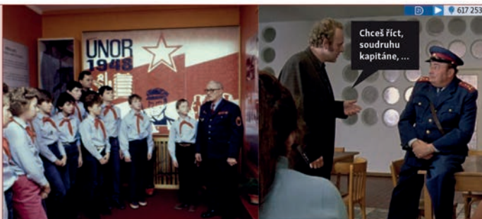
Přisloučníci jednotky Lidových milicí v n. p. JAWA Týnec nad Sázavou pořádají časté besedy s dětmi ze základních škol na okrese Benešov (1986, dobový text).