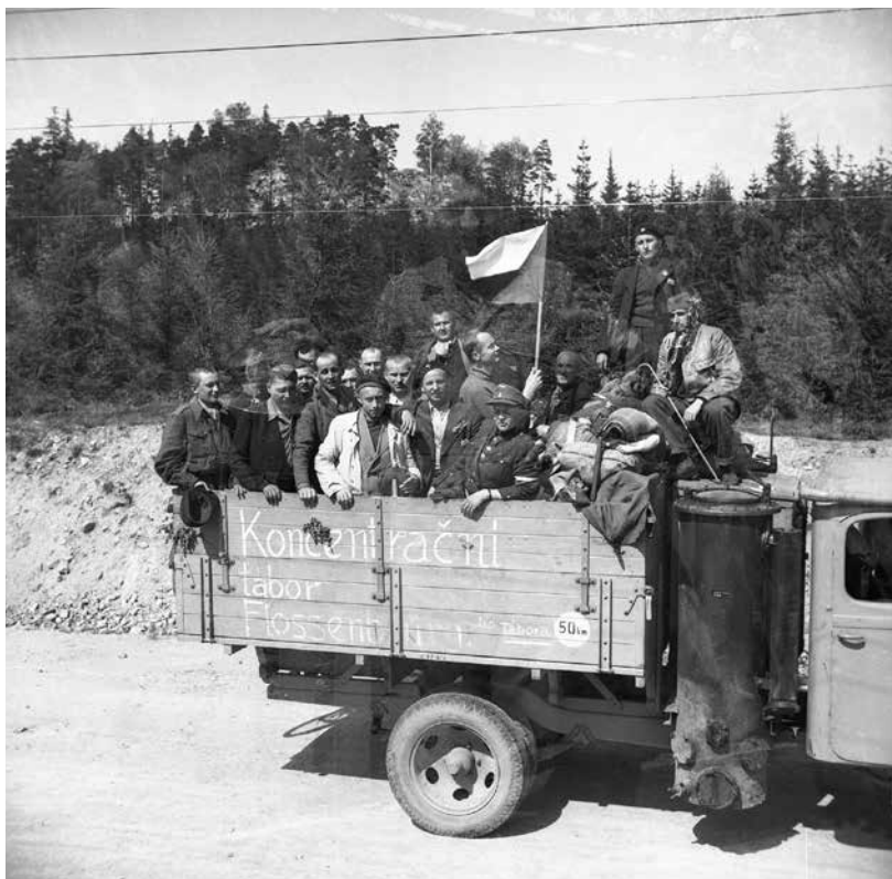
Další snímek Miroslava Zikmunda z května 1945 zachycující transport bývalých politických vězňů