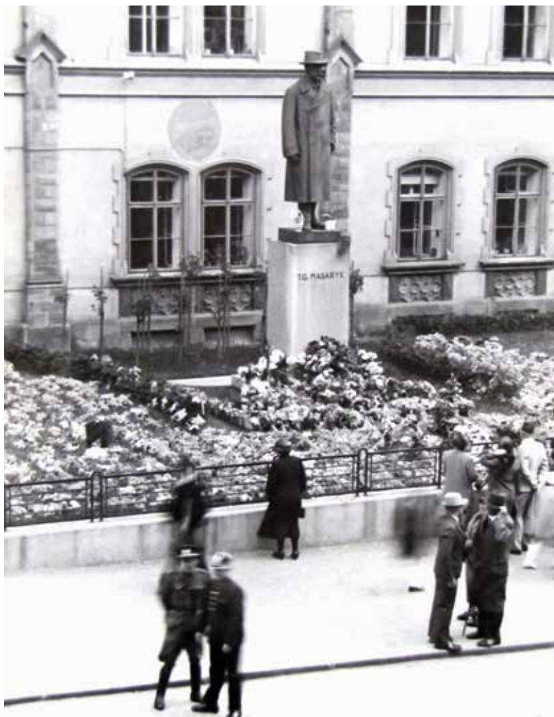
Tichá květinová demonstrace 28. října 1939 u pomníku T. G. Masaryka v Lounech, který byl později nuceně odstraněn