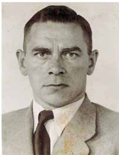
Vrchní kriminální tajemník Johannes Rimkus a polní rozsudek VIII. soudu SS a policie nad ním