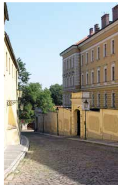
Vazební věznice pro příslušníky Gestapa a SS se stal objekt na Loretánském náměstí, který v 50. letech nechvalně proslul pod krycím názvem „Domeček“

institutu v Berlíně-Charlottenburgu. V hodnosti kriminálního komisaře se zúčastnil okupace českého vnitrozemí a následně byl jmenován vedoucím venkovní služebny v Moravské Ostravě. V rámci arizací židovského majetku zabavila služebna mj. více než sto osobních automobilů, které měly být ohodnoceny a za odhadní cenu prodány německým ozbrojeným složkám.