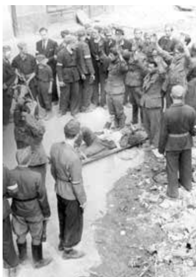
Odsouzení důstojníci často putovali do trestních jednotek, které se účastnily zvláště nebezpečných akcí, např. potlačování Varšavského povstání v roce 1944

V roce 1940 odešel od Gestapa a stal se z něj samostatný obchodník. Dřívějších kontaktů a informací využil k získání arizované průmyslové prádelny v Brně, kterou koupil hluboko pod cenou. Později si v Brně pořídil ještě firmu na výrobu hraček. Ale v roce 1942 došlo i na protřelého Guldeho. Dne 9. května 1942 byl vyloučen z NSDAP 34 a tři dny poté zatčen v Brně kriminální policií. Následně se u něj při domovní prohlídce našlo značné množství textilií. 35 Kvůli podplácení i přijímání úplatků byl 13. října 1942 odsouzen ke třem letům vězení. 36 Přišel rovněž o pofidérně nabyté společnosti, na což si stěžovala jeho žena přímo K. H. Frankovi. 37 Trest si