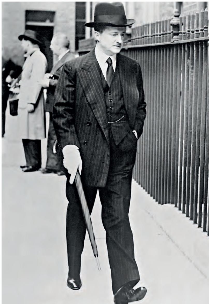
Duff Cooper jako ministr námořnictva (First Lord of the Admiralty) přichází 1. září 1938 na jednání kabinetu. O měsíc později podá demisi.

V roce 1917 narukoval a půl roku strávil na frontě ve Francii. V těžkých bojích, kterých se zúčastnil, prokázal mimořádnou odvalu. Měl štěstí – byl sice lehce raněn, ale válku přežil. Z jeho oxfordské skupinky největších přátel, tzv. Coterie, přitom za války zahynuli téměř všichni, včetně Raymonda Asquitha (syna bývalého premiéra). Velká válka tragicky zdecimovala britskou elitu a stala se psychologickým základem hlubokých obav z dalšího možného válečného