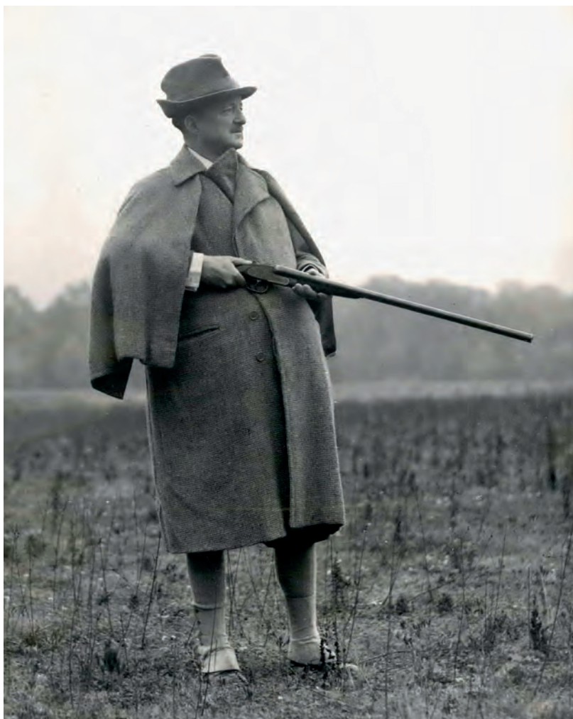
V říjnu 1953, krátce před smrtí, na honu v Rambouillet