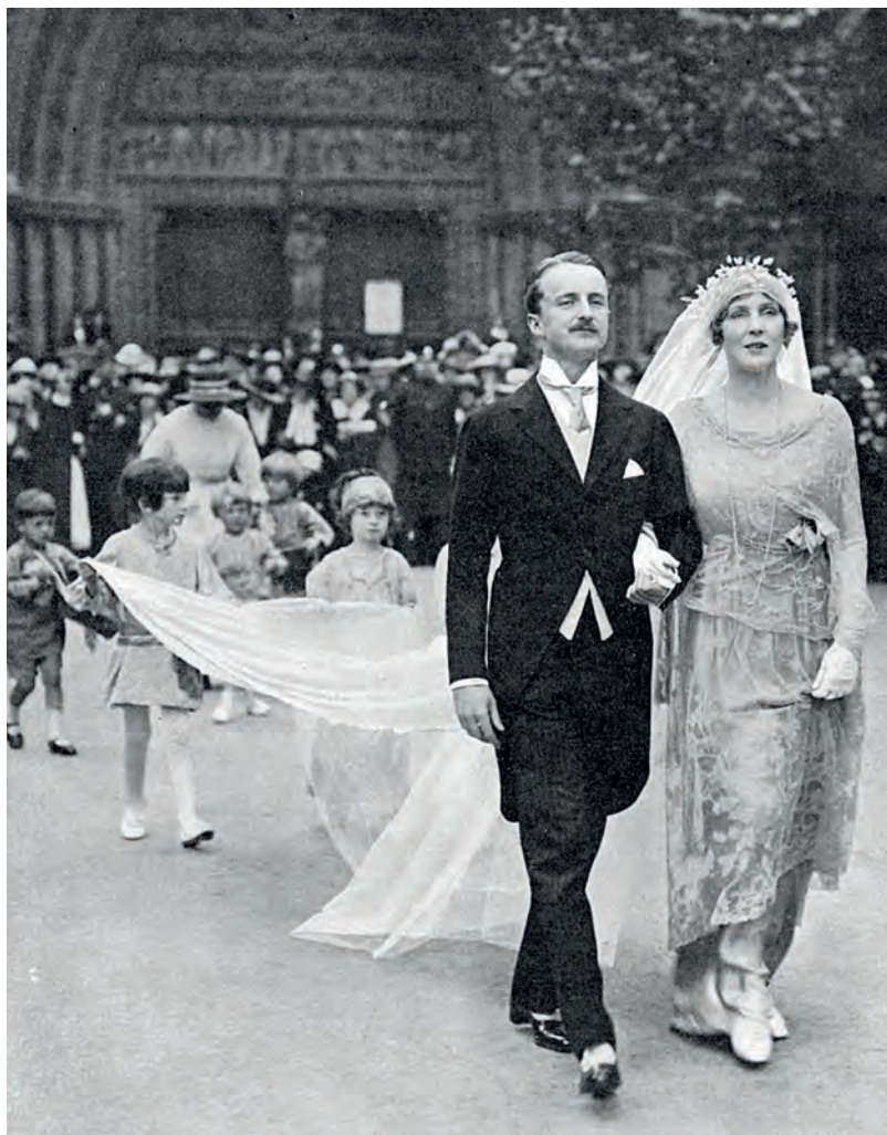
Svatba Alfreda Duffa Coopera a lady Diany Manners, 1919

Duff Cooper po studiích vstoupil do diplomatických služeb, ovšem do života jeho i celé jeho generace brzy přinesla zlom první světová válka.