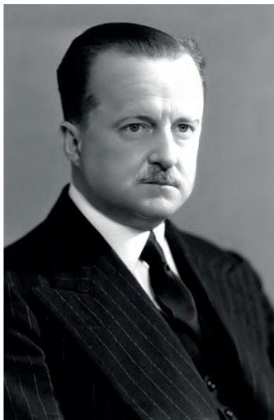
Na portrétním snímku z roku 1939

Do nového válečného kabinetu byl Chamberlain nucen v září 1939 přizvat i členy vlastní nespokojené