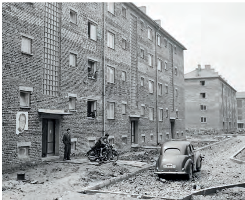
Bytovka na sídlišti Stalingrad v Zábřehu nad Odrou, kde žili italská dělníci

Vedle nízkých mezd měly na situaci a náladu dělníků negativní dopad také jejich neutěšené pracovní a sociální