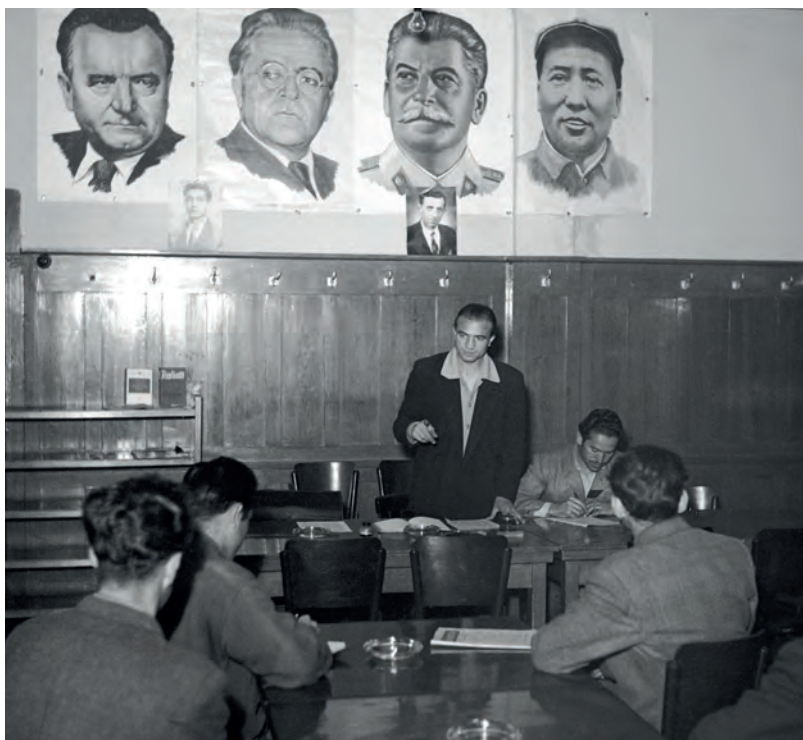
Z Itálie mělo dle dohody přijet pět tisíc dělníků, nakonec jich dorazila jen čtvrtina. Ti uvědomělí pořádali schůze, jako byla tato v květnu 1952 v Zábřehu nad Odrou, pod portréty komunistických vůdců (druhý zleva šéf KS Itálie Palmiro Togliatti).

Na počátku československých úvah o přijezdu pracovníků z Itálie se hovořilo dokonce o 100 000 (!) dělníků. V rámci italského emigračního hnutí již v roce 1946 údajně jen v Padově registrovali na 1 500 zájemců o vycestování do ČSR. Italsko-československá dohoda o emigraci podepsaná v Římě 10. února 1947 stanovila rámec pro nábor 5 000 italských dělníků. Část jich přicestovala hromadnými transporty, jiní však do pracovního poměru vstupovali jednotlivě. Do Československa na základě dohody přijelo nakonec v roce 1947 pouze 1 228 Italů. Celkově jejich počet během dalšího roku dosáhl až 1 352 osob. Na rozdíl od jiných mezistátních dohod předpokládala ta s Itálií zaměstnání dělníků nejen v zemědělství (2 000), ale také v průmyslových oborech, konkrétně v hlubinných dolech (600), v povrchových uhelných dolech (1 400), na