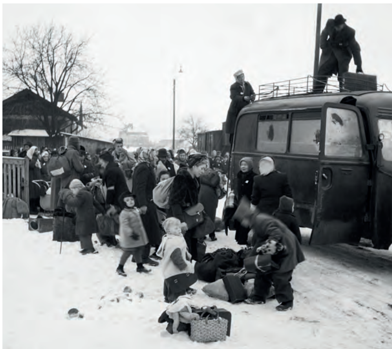
Vysídlení sudetských Němců způsobilo po válce v Československu velký nedostatek pracovních sil. Mariánské Lázně, leden 1946.

V podmínkách ekonomiky směřující po válce od silných státních zásahů k centrálnímu plánování byl