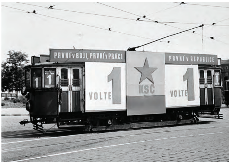
Předvolební kampaň KSČ v květnu 1946