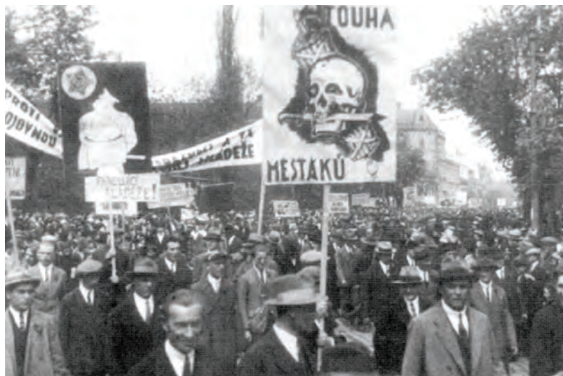
Původní straníci tvořili v poválečné KSČ minoritu. Manifestace KSČ v Brně roku 1927.

KSČ se po roce 1945 stala masovou stranou, což jí významně pomohlo jasně zvítězit ve volbách v květnu 1946 a při převzetí monopolu moci v únoru 1948. Obrovský spontánní zájem o členství podporovalo vedení KSČ náborovými kampaněmi. Již při přeregistraci členství, spojeném s výměnou prozatímních průkazů za řádné legitimace, na přelomu let 1946 a 1947 se ovšem ukazovalo, že vytváření komunistické strany „pro zdrucující většinu národa“ s sebou nese rozpor mezi všelidovým nábohem a obrazem ukázněného člena elitní organizace. Po únoru 1948 zájem o členství ještě zesílil a současně pokračoval intenzivní, někdy až nátlakový nábor (například přibližně 320 000 bývalých členů likvidovaných nekomunistických stran nebo 123 000 sociálních demokratů po násilném sloučení v létě 1948). KSČ si totiž své panství chtěla potvrdit manifestačním vítězstvím ve volbách v květnu 1948 proti „bílým lístkům“, což se jí podařilo. Koncem roku 1948 tak čítala přes 2,5 milionu členů a kandidátů, z toho přes 400 tisíc na Slovensku, a měla v přepočtu na hlavu dvakrát víc členů než maďarská a čtyřikrát víc než polská komunistická strana. Vedení KSČ tak mohlo při budování nového Československa pracovat s impozantním rezervoárem lidských zdrojů.