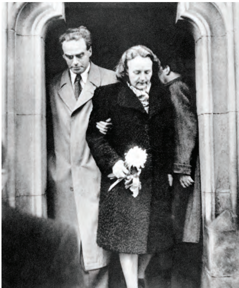
Rudolf Slánský a Marie Švermová při ukládání ostatků Jana Švermy v prosinci 1945

Švermová totiž zprvu váhala toto slovo použít, neboť ho mylně považovala za nečeské, takže „si pomohla slovem kontrola“. Slánský odmítl zavést kategorii kandidátů členství, kterou doporučoval hlavní sovětský ideolog Andrej A. Ždanov, neboť tento nástroj neměla KSČ zakotven v organizačním řádu. Tehdejší pnutí mezi stalinizací a národními specifiky se odráželo též