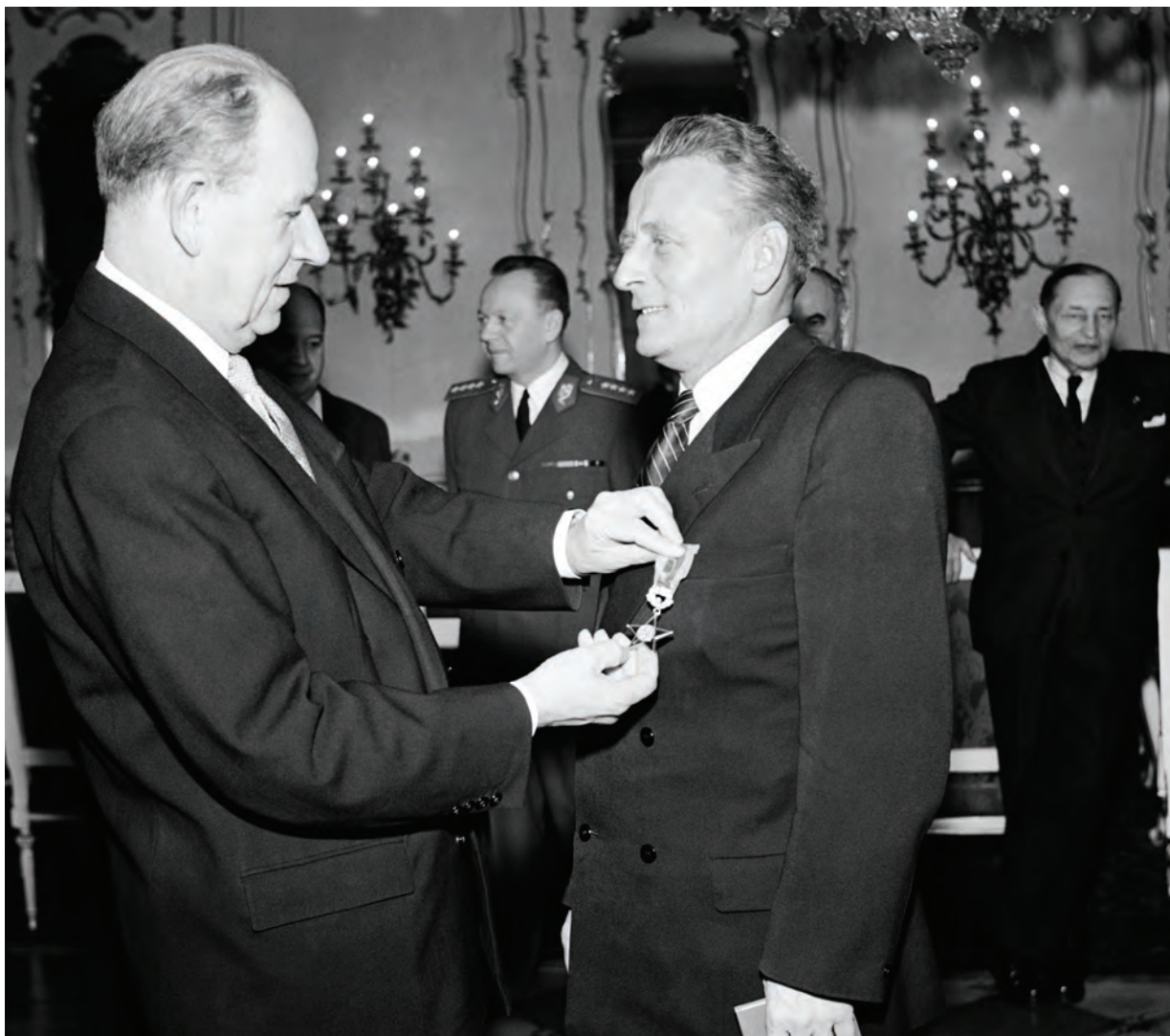
Antonín Zápotocký a Antonín Novotný v prosinci 1954. První uděluje druhému Řád budování socialistické vlasti.

Existovaly samozřejmě regionální rozdíly. Například v okrese Opava dosáhl počet vyloučených a vyškrtnutých nadprůměrných 19,3 procenta, přičemž 36 procent vyloučených bylo z řad dělnictva. Když chtěl krajský sekretariát v Ostravě po Oldřichu Černíkovi, vedoucím tajemníkovi OV KSČ v Opavě, vysvětlení, Černík tvrdil, že okres ztratil kontrolu nad prověřovacími trojkami a také že