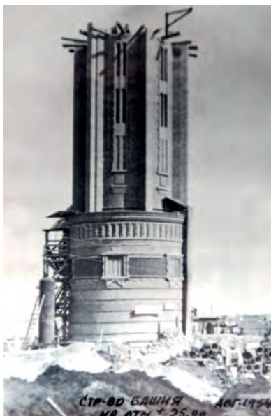
Stavba vodárenské věže v Intě a její architekt Artur Gustav Tamvelius

Vodárenská věž, v níž se muzeum nachází, je symbolem města, součástí