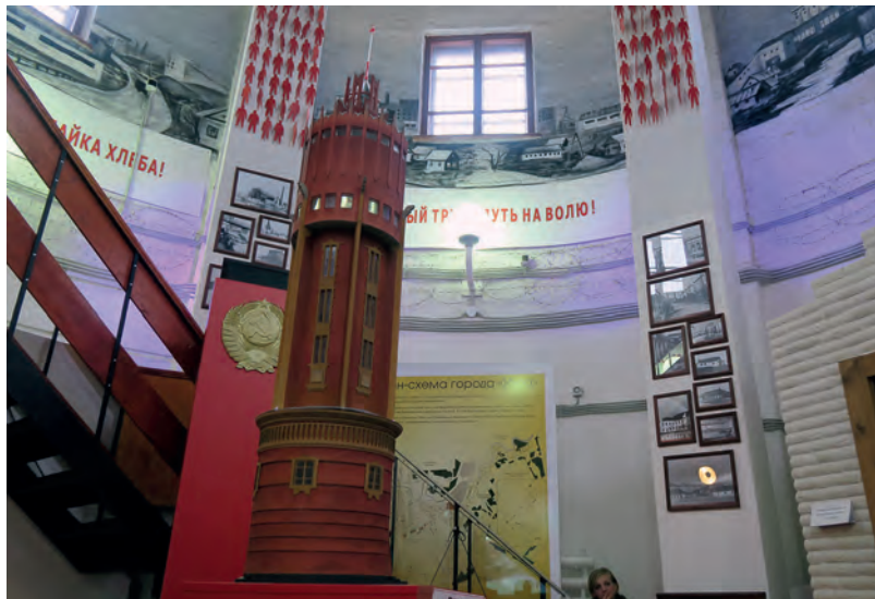
Vstupní hala Muzea historie politických represí v Intě v budově bývalé vodárenské věže