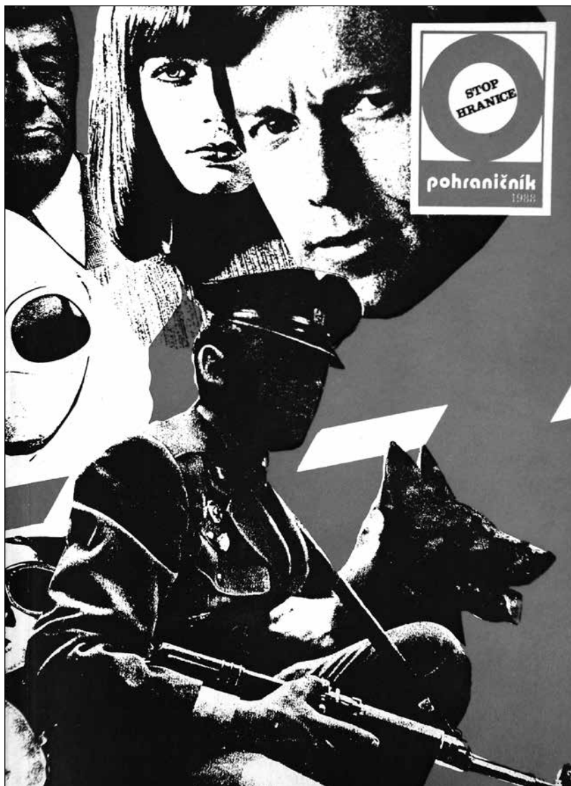
Titulní strana magazínu Stop hranice , vycházejícího jako příloha časopisu Pohraničník – Stráž vlasti