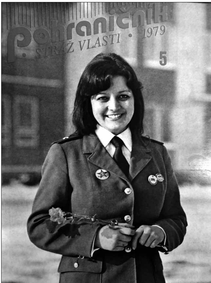
Titulní strana časopisu Pohraničník - Stráž vlasti z roku 1979