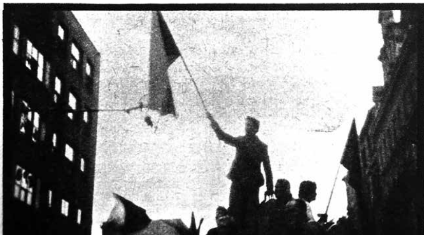
Odvážná slova i obavy z věcí příštích. Poselství redakce Signálu čtenářům z 6. září 1968.

Děkujeme všem čtenářům i příznivcům za podporu; a především všem těm, kteří nám ve dnech apokalypsy pomáhali. REDAKCE