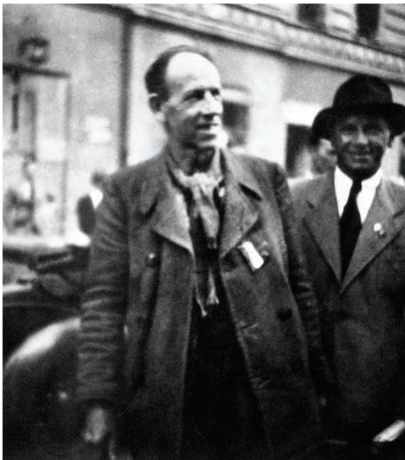
První snímek Antonína Zápotockého po návratu z koncentračního tábora, 29. května 1945

Informace o tom, že Antonín Zápotocký měl týrat své nizozemské spoluvězně v koncentračním táboře Sachsenhausen, se objevila bezprostředně po válce. 1 V obecném povědomí se udržela celá desetiletí, přestože nebyla podložena žádnými dokumenty. Dnes již víme, že existují materiály, které minimálně část tohoto obvinění vyvracejí. V srpnu 1946 reagovalo nizozemské vyslanectví na kolující fámu nótou, kterou adresovalo československému ministerstvu zahraničí a tisku. V ní se píše: „Nizozemská ambasáda vyjadřuje svou úctu a dovoluje si informovat ministerstvo zahraničních věcí, že dnes