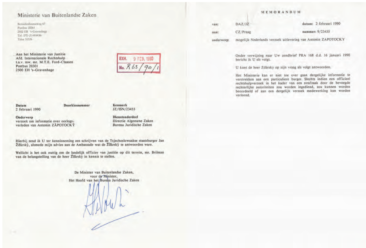
Dokumenty z nizozemského Národního archivu k žádosti československého občana z roku 1990 o informace k činnosti Antonína Zápotockého za války

tolíci, na rozdíl od holandských protestantů, nespocovali s nacisty. [...] Holanští katolíci nenáviděli nacisty i komunisty. Mohla to být i tato skutečnost, že Zápotockého (sic), který se netajil svým komunistickým smýšlením a své názory na rozdíl od ostatních, kteří se o politice mluvit báli, otevřeně projevoval, byl proto Holanďany nenáviděn. Zápotocký, když se ho někdo již v osobožené vlasti ptal, zda řezal Holanďany, odpověděl, že řezal ‚Holanďany‘, to je dřevěné pantofle.“ Šárka na roli Antonína Zápotockého v táboře vzpomíná poměrně podrobně a na informace o jeho podílu na násilí vůči spolupovězňům hledí s nedůvěrou. 6