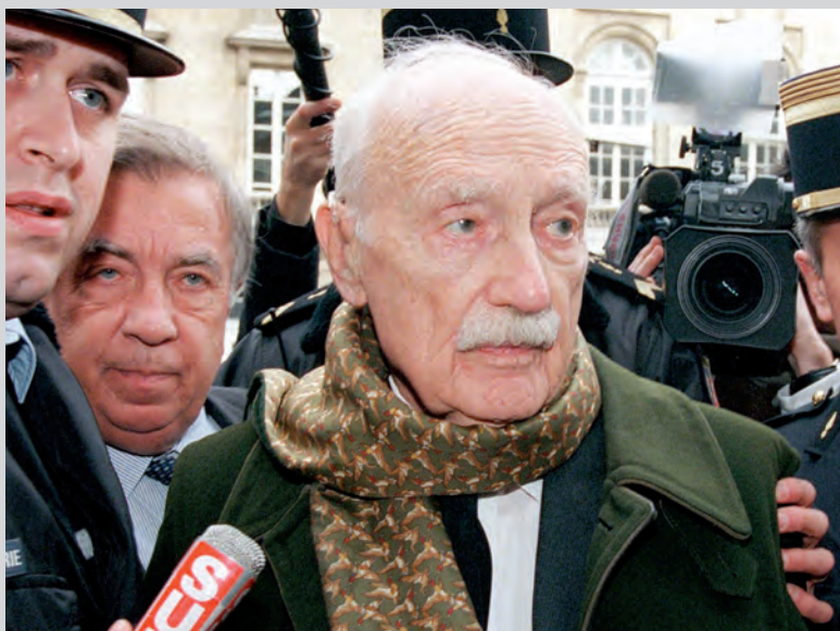
Bývalý šéf pařížské policie Maurice Papon