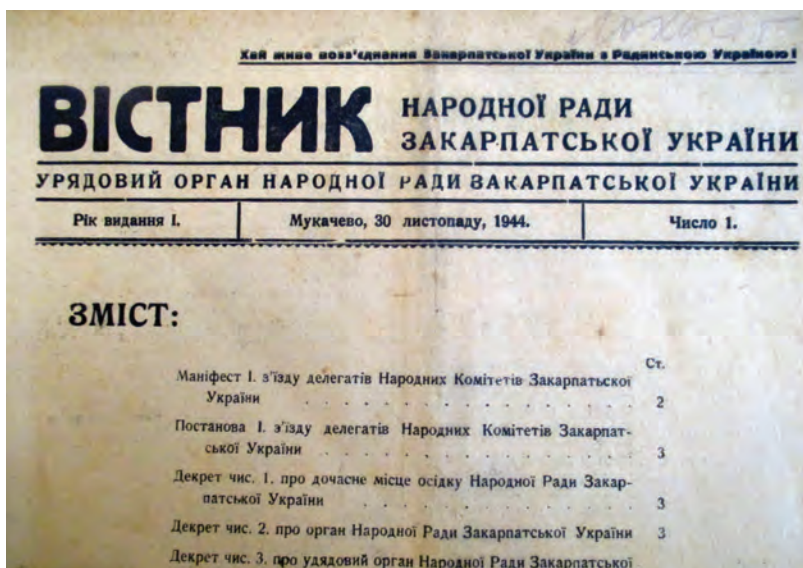
První číslo Věstníku Národní rady Zakarpatské Ukrajiny z 30. listopadu 1944

Dekrety, jimiž NR ZU vládla, začaly od základů měnit zakarpatskou spo-