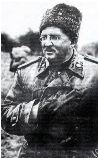
Velitel IV. ukrajinského frontu generál Ivan Jefimovič Petrov na snímku z roku 1944