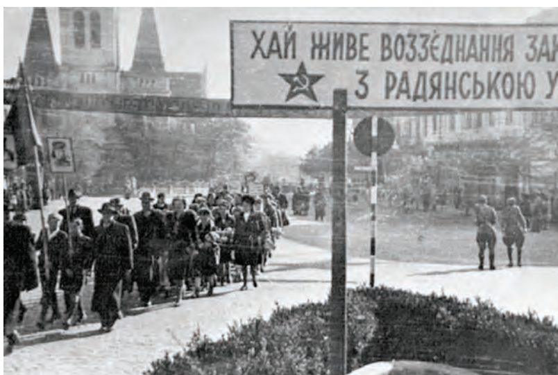
Mukačevo bylo hlavním centrem hnutí za „znovusjednocení“ a protičeskoslovenské propagandy