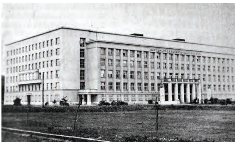
Budova bývalého Zemského úřadu v Užhorodě na dobovém snímku jako sídlo Národní rady Zakarpatské Ukrajiny