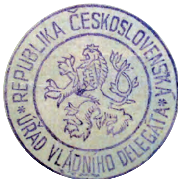
Oficiální razítko Úřadu vládního delegáta

tektorů a s podporou Rudé armády, takže československé úřady a Slovenská národní rada se musely se ztrátou důležité dopravní křižovatky tiše smířit. Zakarpatští ozbrojenci vstoupili přechodně i na maďarské a rumunské území. Za součást Zakarpatí považovali v té době například i Marmarošskou Sihoť a 17 rusínských vesnic ležících v Rumunsku, z nichž vytvořili marmarošský okres ZU. V květnu 1945 však Stalin úvahy o připojení Marmaroška, stejně jako Prešovska, kde sílily separatistické tendence, „velkoryse“ odmítl.