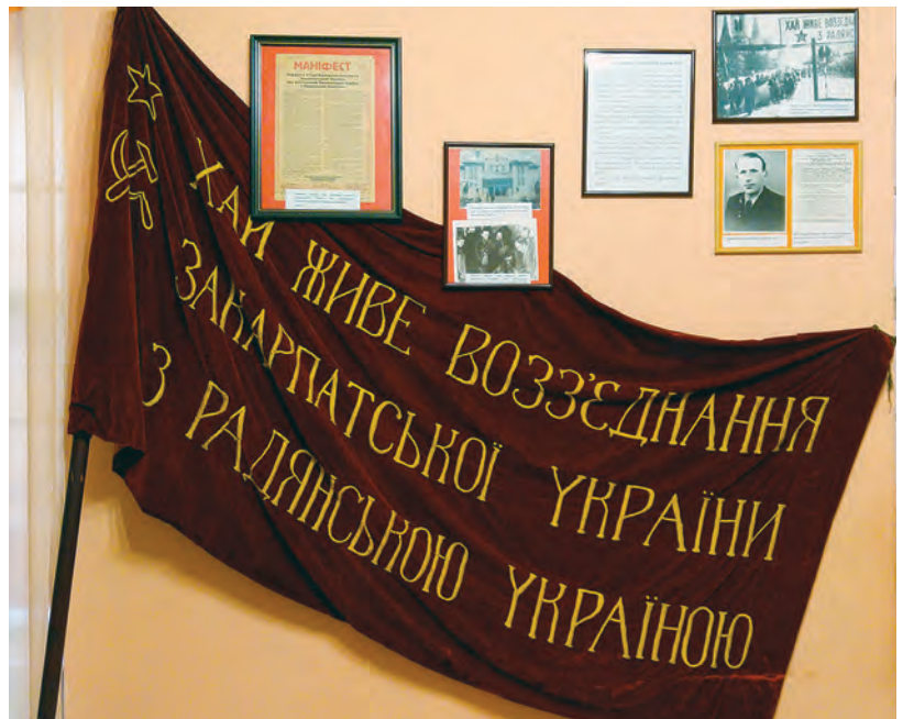
Státní prapor Zakarpatské Ukrajiny je nyní vystaven v muzeu regionální historie na užhorodském hrade

Kromě novinových článků a občasných provokací proti vojákům a úředníkům se však zakarpatské orgány zatím proti československým úřadům zasáhnout neodvážily. Neměly k tomu