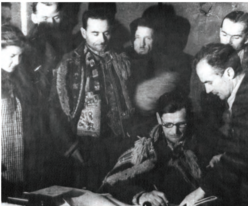
Hlasování delegátů „veřejnou aklamací“ a podepisování Manifestu I. sjezdu NV