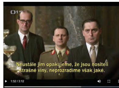
Tříkrát příslušníci SNB: Expres z Norimberka (1953), Občanský průkaz (2010), České století (2013)

nostní orgány a režim se také opíraly o veřejně sdílený apel na přizpůsobení se poměrům.