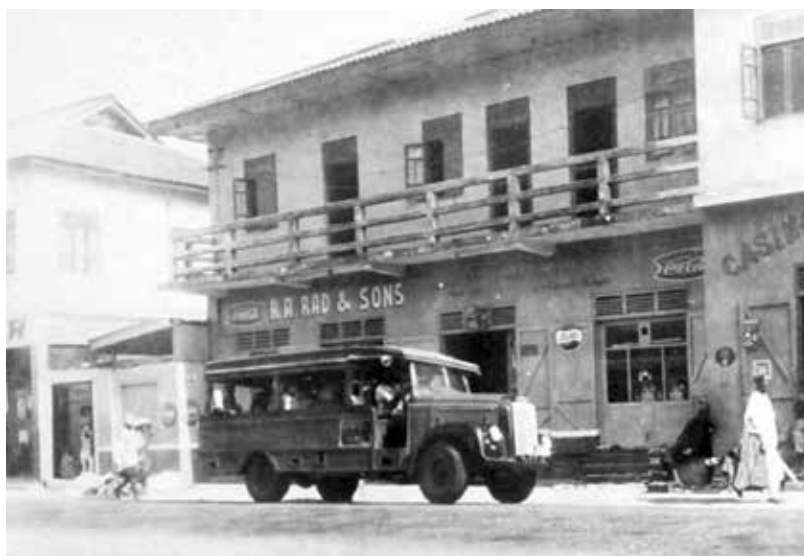
Ulice v Sekondi-Takoradi v roce 1961

Již od počátku vědecko-technické spolupráce se Československo snažilo vysílat do Ghany své experty z oblasti národohospodářství, plánování, vzdělávání, průmyslu či zdravotnictví. Ghana prostřednictvím velvyslance Josefa Antoše žádala Prahu o desítky odborníků. Nejobvyklejší způsob výjezdu těchto lidí do států třetího světa byl prostřednictvím podniků zahraničního obchodu, zejména PZO Polytechna, který se na „vývoz expertů“ zaměřoval (např. v roce 1962