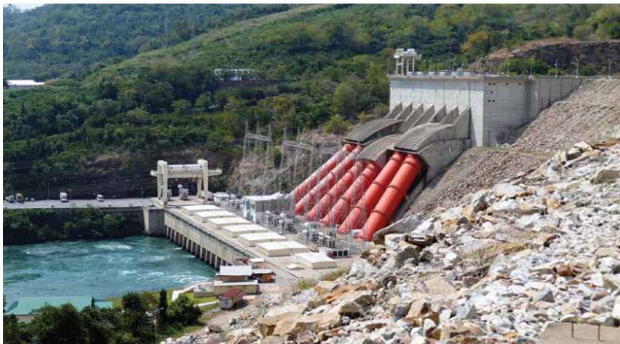
Hydroelektrárna přehrady Akosombo