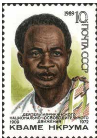
Kwame Nkrumah na sovětské poštovní známce