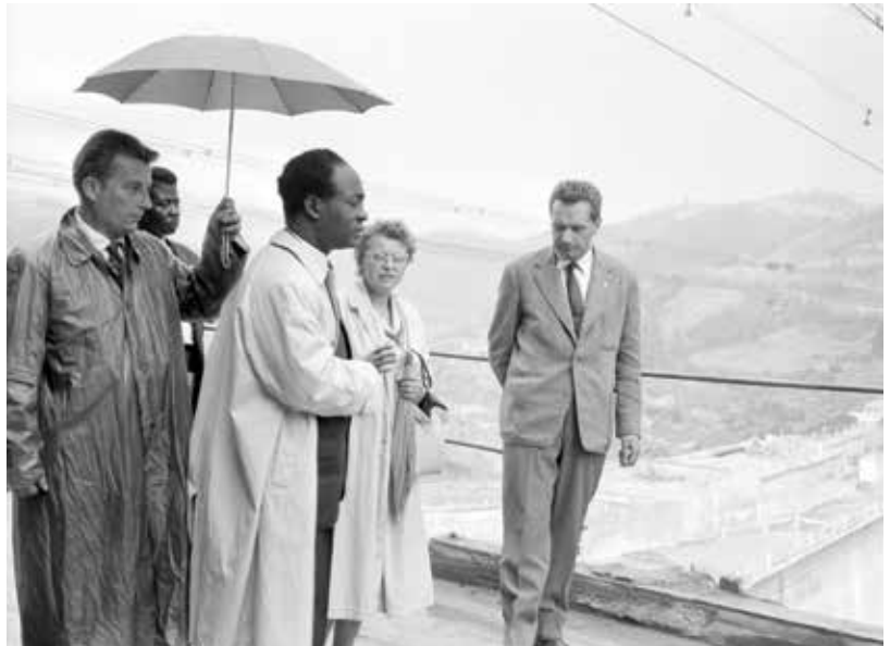
Ghanský prezident Kwame Nkrumah obhlíží během státní návštěvy ČSSR stavbu vodního díla Orlík, 1961

O jakou skupinu šlo a co bylo jejím úkolem? Kontrakt se uskutečnil pod záštitou PZO Technoexport, který uzavřel hospodářskou smlouvu se Státním ústavem projektování vo-