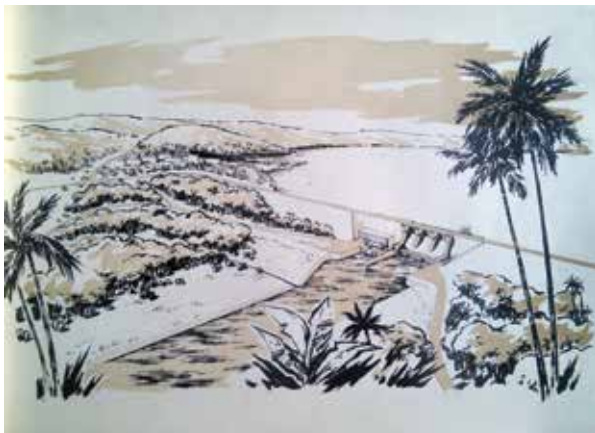
Vizualizace přehrad a hydroelektráren Hemang a Tanoso

Ghana nebyla jedinou zahraniční misí Hydroprojektu. Během studené