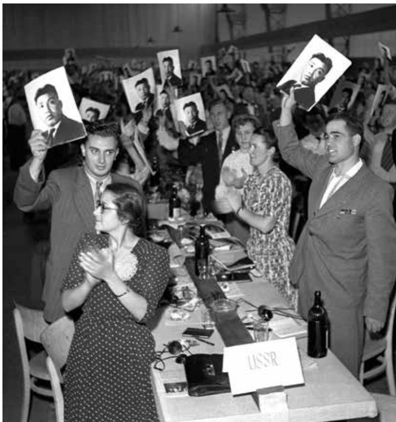
Delegáti při zahájení II. kongresu Mezinárodního svazu studentstva s portréty korejského vůdce Kim Ir-sena, Praha, 14. srpna 1950

Československo a Afriku (potažmo „druhý“ a „třetí“ svět) lze pochopitelně zkoumat i z jiných úhlů, než jsou různé roviny bilaterálních vztahů. Již bylo naznačeno, že dalšími východisky může být například transnacionální či „spaciální“, prostorová historie. Jednou z možností, jak tohoto přístupu využít, je zkoumání „kontaktních zón“ – prostorů, v nichž se střetávali představitelé rozdílných kultur a myšlenkových světů, často poznamenaných předsudky a stereotypy. Takovými prostory mohou být školy, koleje, pracoviště, bary, komunity expertů či exulantů, studentské spolky i mezinárodní organizace. 45 Na podkladu kontaktních zón se dají zkoumat sociálně-historická témata, ale také třeba proměny identit v migrantských komunitách. Příkladem prostorové konceptualizace – byť ne nutně ve fyzickém smyslu prostoru – může být rámec tzv. černého východu (Black East), který zahrnuje specifika a propojenost černých diasporických komunit v socialistických zemích. 46