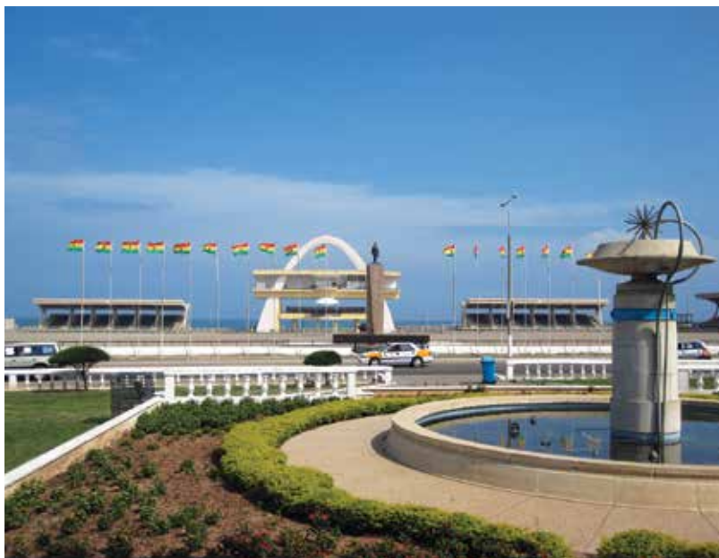
Náměstí nezávislosti v ghanském hlavním města Akkra zbudované podle socialistických architektonických vizí

Dekolonizace nebyla pouze procesem politické, ale také ekonomické a sociální transformace, v níž Spojené státy a Sovětský svaz spatřovaly příležitost nabídnout africkému kontinentu vlastní modernizační model, který by přeměnil bývalé kolonie na prosperující státy. Pro obě velmoci se tím otevřel prostor pro nové formy vzájemného soupeření – prezentaci vlastních ideologických postulátů a modernity. Vedle oblastí Latinské Ameriky a Asie, jež studená válka zasáhla již v padesátých letech, se o desetiletí později hlavním dějištěm velmocenského zápasu o „srdce a mysl“ obyvatel třetího světa stal africký kontinent, jež kromě rozsáhlých ideologicko-politických možností představoval také zajímavý hospodářský a surovinový potenciál. 17