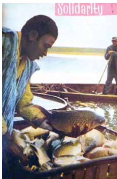
Obálky časopisu Solidarity

Československá kulturní diplomacie využívala mnoho kanálů. Lze sem zařadit distribuci československých filmů, pořádání výstav, propagační zájezdy sportovců, vědců, filmařů či hudebníků. Zahraniční vysílání Československého rozhlasu Rádio Praha připravovalo od roku 1960