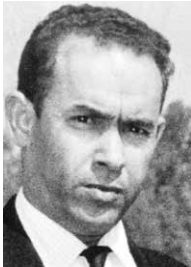
Mehdi Ben Barka, vpravo Amílcar Lopes da Costa Cabral

První úspěchy v oblasti tzv. klasické špionáže (HUMINT – Human Intelligence) se projevoval také rostoucím počtem rezidentur. Mezi nejvýznamnější zpočátku patřily ty v Egyptě, Alžíru, Guineji, Mali nebo Kongu, v sedmdesátých a osmdesá-