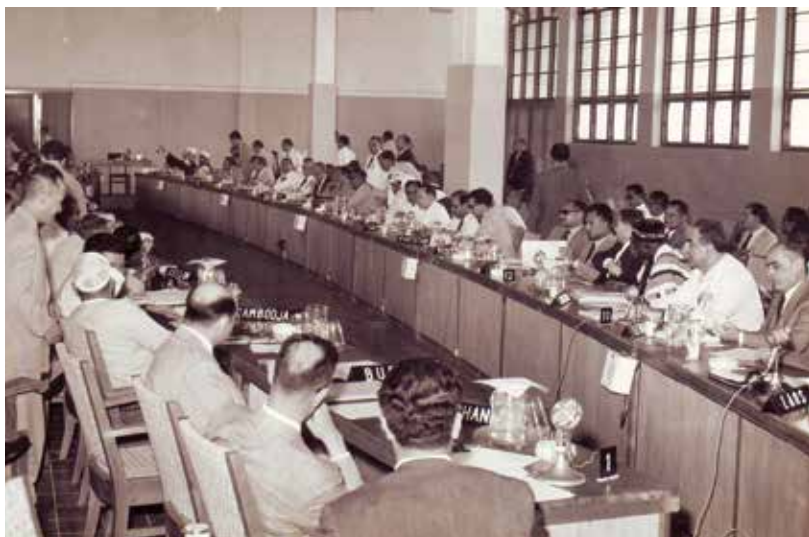
Plenární setkání delegátů bandungské konference, její ekonomické sekce, 20. duben 1955