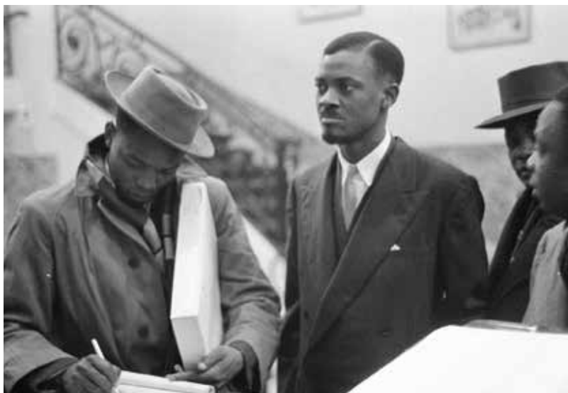
Patrice Lumumba (uprostřed) během konference v Bruselu v roce 1960

Patrice Émery Lumumba (2. 7. 1925 – 17. 1. 1961), vůdčí postava osvobozenického hnutí v bývalém Belgickém Kongu, který se nakrátko stal prvním předsedou nově vyhlášené Konžské republiky (nyní Demokratická republika Kongo), byl v září 1960 sesazen vojenským převratem vedeným plukovníkem Mobutu Sese Sekem a uvězněn. Při pokusu o útěk byl zadržen a deportován do odtržené provincie Katanga. Přes protesty světové veřejnosti byl v lednu 1961 zavražděn belgickými důstojníky. Jeho osud inspiroval řadu literárních děl, např. divadelní hru Sezona v Kongu ( Une saison en Congo ) básníka, spisovatele, politika a významného černošského intelektuála 20. století Aimé Césaire z Martiniku. Pro své postoje a násilnou smrt se Lumuba stal hrdinou-mučedníkem nejen ve své zemi, ale v celé černé Africe a jako „globální symbol“ protikoloniálního boje počátku šedesátých let rezonovalo jeho jméno i ve zbytku světa.