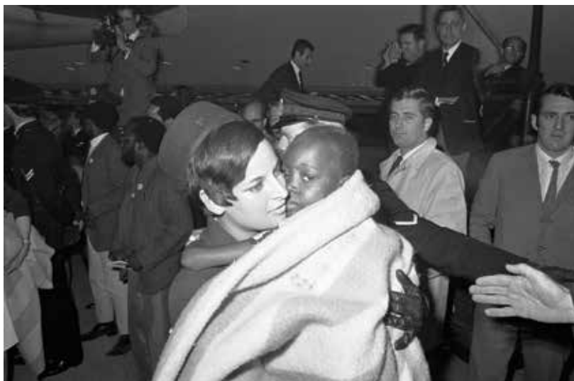
Humanitární katastrofa spojená se státem Biafra vyburcovala veřejnost v celé Evropě. Snímek z amsterdamského letiště Schiphol, kam 9. října 1968 dorazilo pět biaferských dětí.