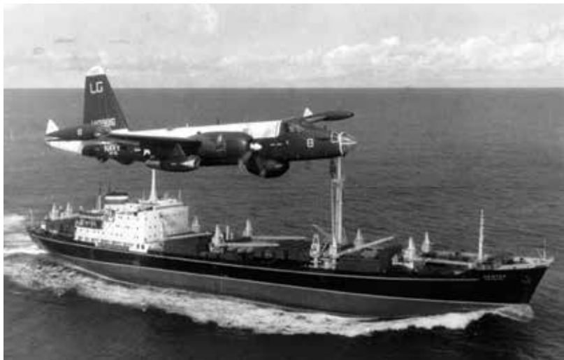
Americké vojenské letadlo sleduje sovětskou nákladní loď během kubánské krize v roce 1962