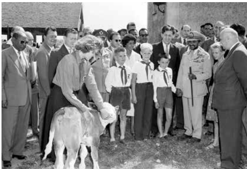
Jeho císařské veličenstvo Haile Selassie I. v JZD Chýně při prohlídce družstevního hospodářství. Do ČSSR dorazil etiopský panovník na pozvání prezidenta ČSSR Antonína Novotného v červenci 1959.