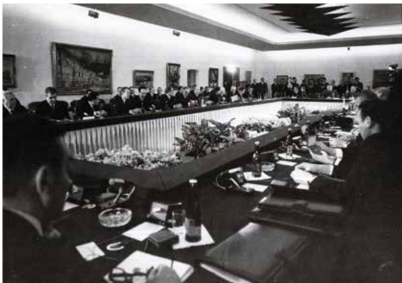
Zasedání Politického poradního výboru Varšavské smlouvy v Praze v roce 1972

Jednotlivé studie dokládají i to, že přístup Sovětského svazu k aktivitě zemí východního bloku se velmi lišil. Zatímco některým státům se v této věci dostávalo spíše jeho podpory (Československo), v jiných případech z mnoha důvodů projevoval značnou skepsi (Polsko). Jistá míra nezávislosti zemí východního bloku při angažmá ve třetím světě také neznamenala, že jejich aktivity v některých momentech nevycházely z přímých instrukcí Moskvy, jako například při navázání vztahů Polska