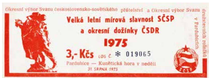
Lístek ze slavnosti pořádané Svazem československo-sovětského přátelství (SČSP) v srpnu 1975 a odznak téhož - na obou je Sbratření zobrazeno