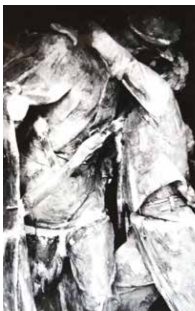
Částečně rozebraný sádrový model při restaurování v roce 1977