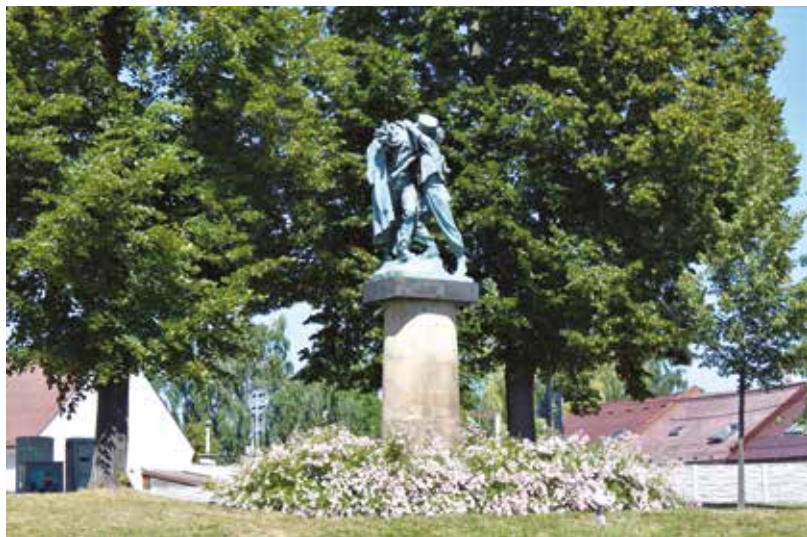
Dnešní umístění původního pomníku Sbratření poblíž dopravního terminálu v České Třebové