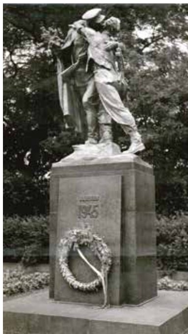
Původní vzhled pomníku ve Vrchlického sadech (1960–1967)

Bronzové sousoší pro Prahu se podle všeho odlévalo až pro instalaci před centrálním vlakovým nádražím do Vrchlického sadů, a to na poslední chvíli. Potvrzuje to i rozhovor