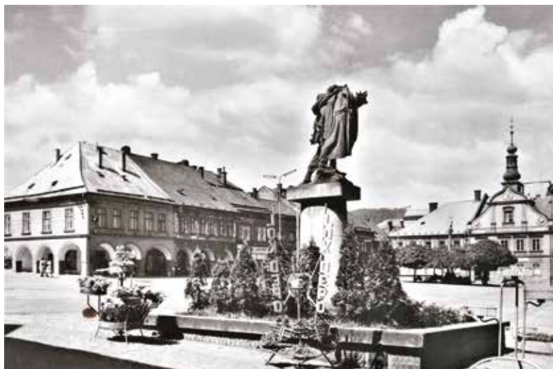
Odznak k slavnostnímu odhalení pomníku v České Třebové a původní umístění pomníku na náměstí