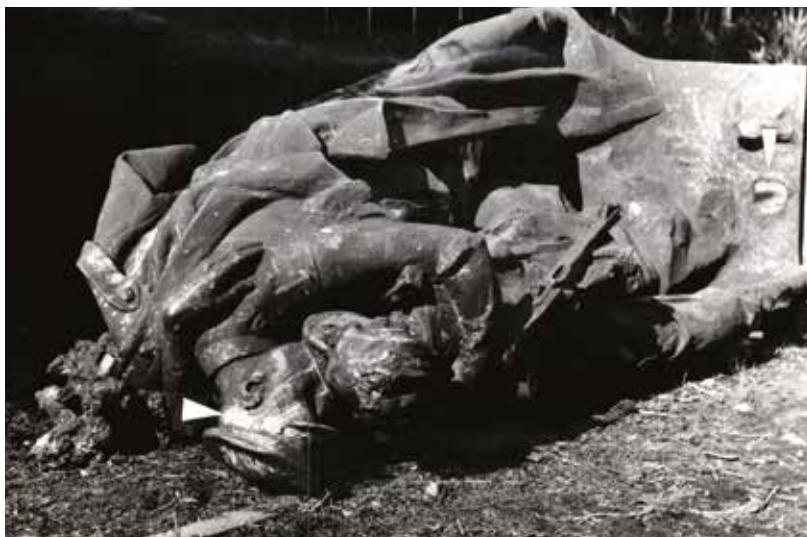
Při přesunu v roce 1967 bylo třeba zacelit otvory vzniklé při demontáži