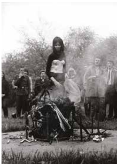
Druhá manifestace Aktuálního umění, 1965

Jeden z nejvýznamnějších českých teoretiků výtvarného umění ve 20. století Jindřich Chaloupecký, 1 který se akce osobně účastnil, si tehdy poznamenal: Pár kroků od široké třídy [...] se před nimi odehrál v symbolické podobě archaický ritus upálení panny. [...] Knížákovy počínání bylo prosto uměleckých ambicí. Jenom osvobodilo lidi od naučeného života, vedlo je k zasunutým vrstvám vědomí, zapomínaným možnostem existence. Hráli jsme si. Knížák postupoval se zvláštní