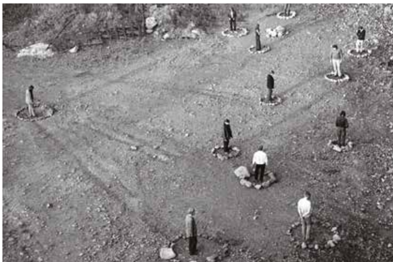
Kamenný obřad, 1971

Nebylo moc překvapivé, když se Knížák po rozchodu s underground-