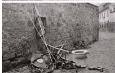
Prostředí na pražském Novém Světě, 1962