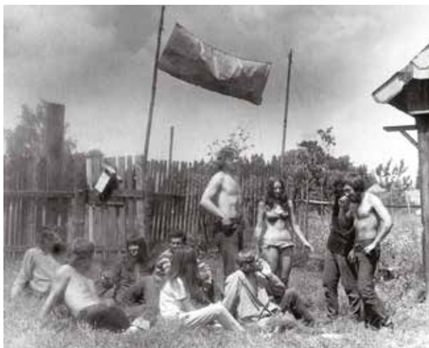
Komuna v Krásném, 1967