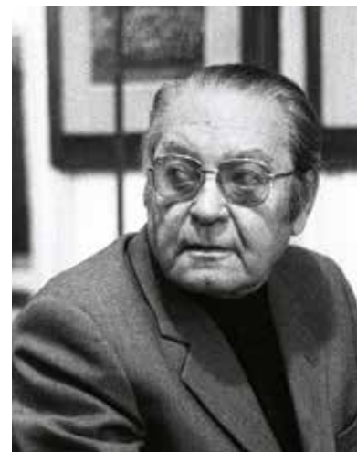
Jindřich Chaloupecký

Milan Knížák bezesporu zachytil tep své doby. Nepostupoval totiž