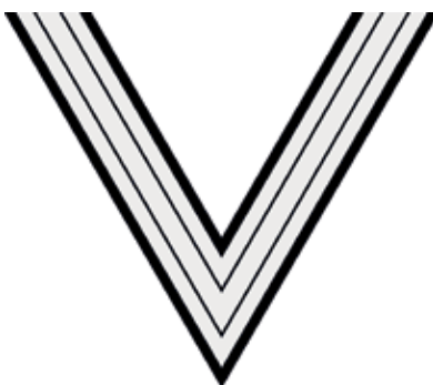
Čestný prýmek starého bojovníka NSDAP