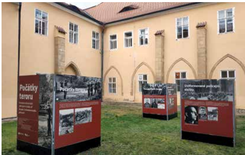
Výstavní panely byly převedeny do on-line podoby, aby si je lidé mohli prohlédnout i v době celorepublikové karantény