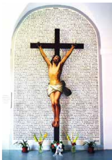
Pietní místo v klášteře Želiv je upraveno jako symbolická pocta kněžím a řeholníkům internovaným zde v letech 1950–1956

Plošná a důkladně provedená akce „K“ patřila k největším a nejradikálnějším počínům, které komunistická moc v 50. letech podnikla proti svým ideovým odpůrcům. Její kulaté, sedmdesáté výročí je dobré připomínat i proto, že důsledky pohybu, který spustila, jsou v našich zemích patrné dodnes – třeba i v bezpočtu velkých klášterních areálů, jež po desetiletích