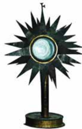
Monstranci z plechovek od okurek a dna zavařovačky tajně vyrobili internovaní řeholníci