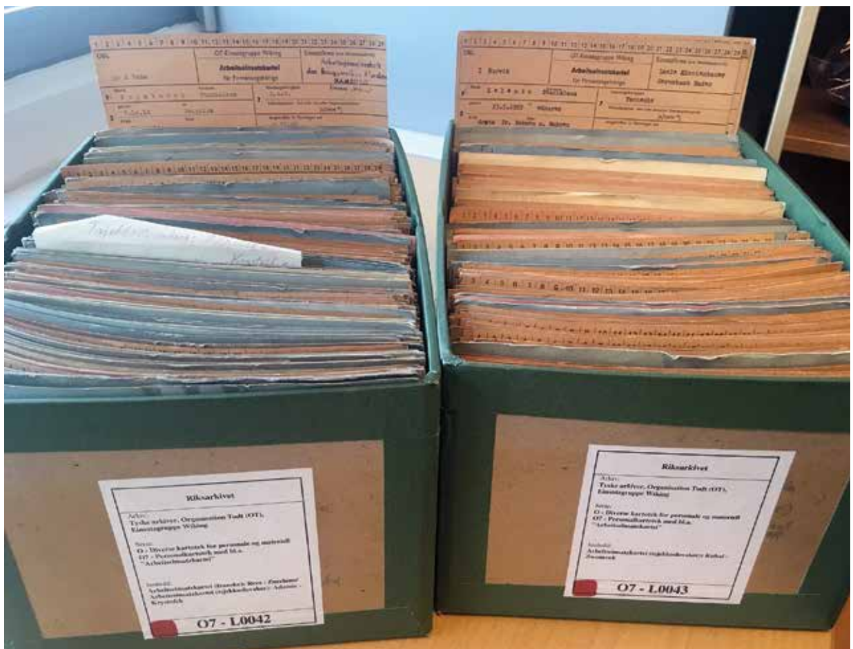
Kartotéční lístky českých totálně nasazených pracovníků jsou v norském Národním archivu uchovány ve dvou kartonech